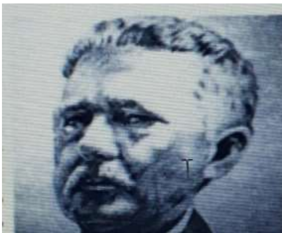
Imagem retirada do livro parceiros da história jaraguense

Depois de nove anos ocorreram mudanças na parte física da escola que atualmente conta com 10 salas de aula, 1 biblioteca, 1 laboratório de informática que não está em condições de funcionamento, 1 sala de atendimento educacional especializado, 1 sala para os professores, 1 sala de gestão, 1 secretaria, sala de coordenação, 1 cozinha, quadra coberta e pátios externos. A escola conta ainda com uma piscina que está em funcionamento atendendo alunos nas modalidades complementares nas aulas de educação física.