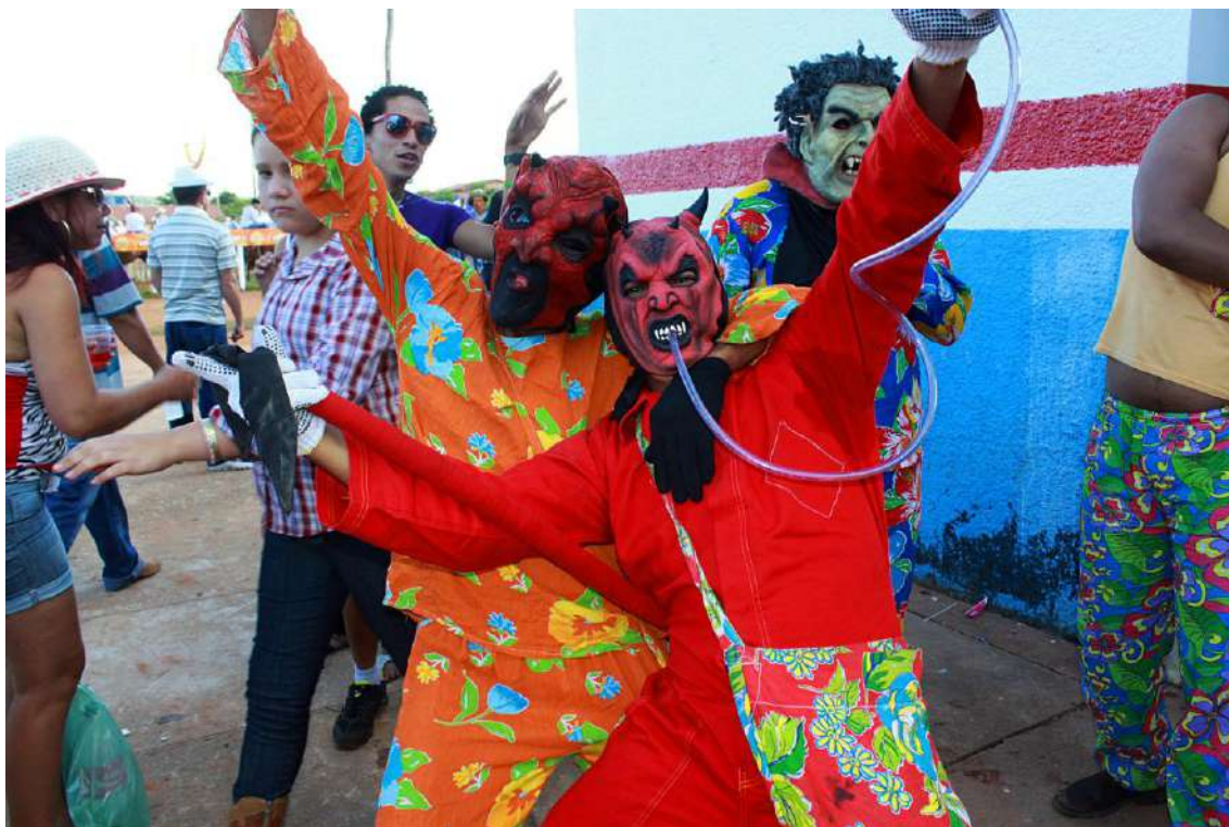
Ilustração 5: Bebendo sem tirar a máscara. Cavalhadas de Jaraguá – GO, 2012.

Além disso, uma grande quantidade de mascarados caminhava pelas ruas e também se posicionava atrás dos camarotes, numa região aberta que comportava diversas atrações. Nesse local, além de ambulância para prestar atendimento em caso de emergência, havia uma série de atrações disponíveis aos participantes, tais como barraca de tiro ao alvo, parquinhos elétricos e pula-pulas infantis, uma piscina onde flutuavam enormes bolas, barracas de comidas e venda de bebidas.