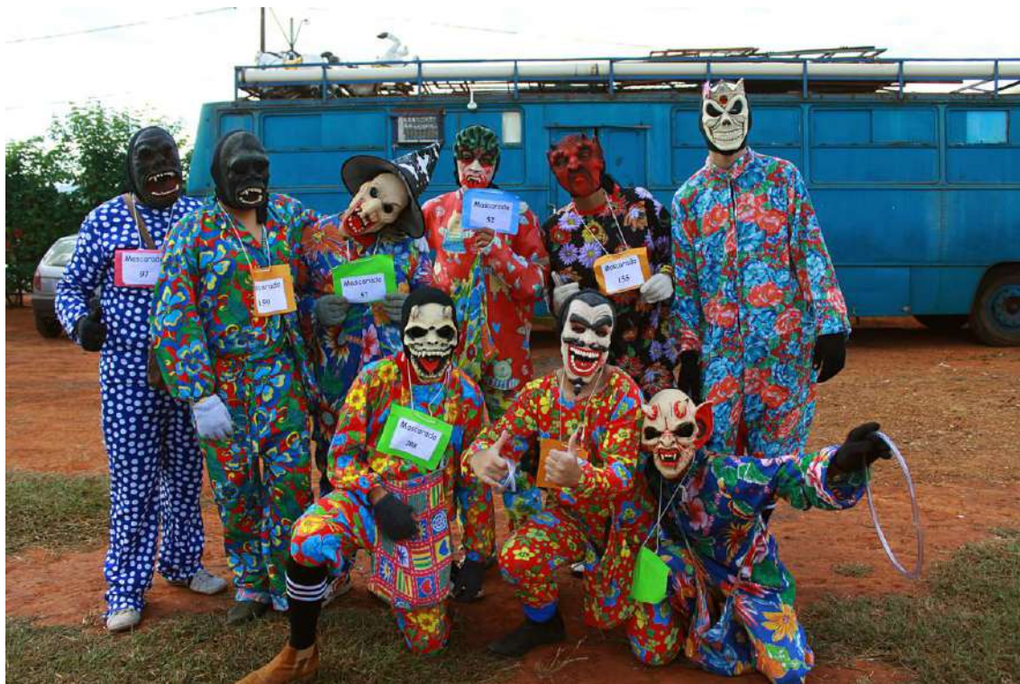
Ilustração 3: Mascarados cadastrados nas Cavalhadas de Jaraguá – GO, 2012.

gente que não tem compromisso com a sociedade, que não tem até educação mesmo e usa de uma máscara no rosto pra demonstrar uma coisa que não tem coragem de demonstrar sem a máscara. Então existe esse tipo de pessoa como em todo lugar, pessoas que não tem esse controle emocional, psicológico, e usa disso pra poder abusar pornograficamente e fazer coisas ilícitas, soltar bombas e machucar outras pessoas. Então, como foi feito isso, melhorou bastante a reação dos mascarados e o respeito deles com a população. Fez foi aumentar o número de mascarados.