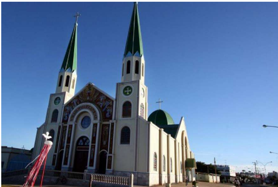
Ilustração 2: Igreja de Nossa Senhora da Penha de Jaraguá – GO.

A Igreja de Nossa Senhora da Penha, no centro da cidade, é imponente e ricamente ornada, com uma fachada decorada por desenhos de cores fortes. Foi possível ver, ao longo da avenida principal, estandartes em alusão ao Divino Espírito Santo e em frente à igreja uma estrutura de barracas para comportar os participantes da Festa do Divino.