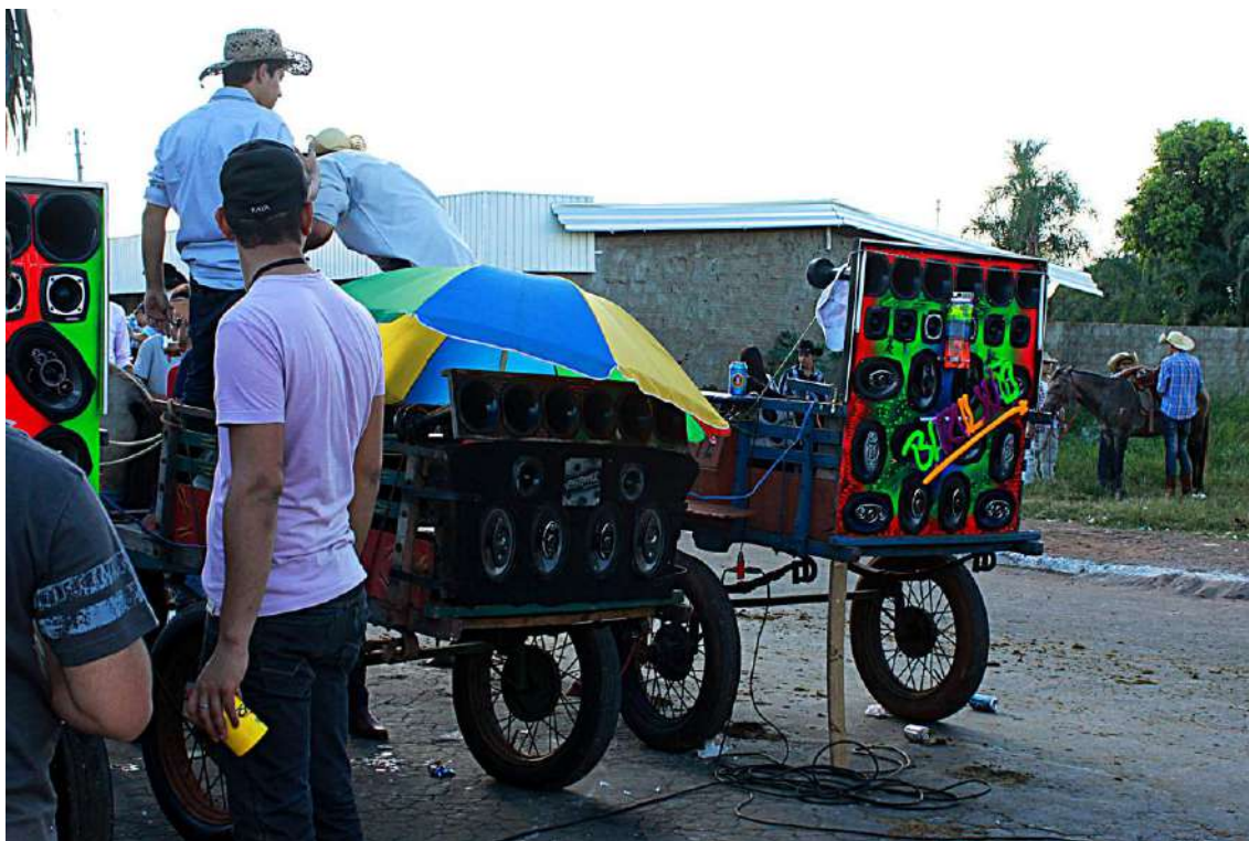
Ilustração 6: “Carroças de som”. Jaraguá – GO, 2012.

E foi nessa ocasião, em que centenas de pessoas se encontravam pelas ruas do centro da cidade de Jaraguá, que realizei a aplicação de questionário visando principalmente conhecer a opinião dos moradores a respeito do cadastramento dos mascarados, que nessa localidade já está implementado há cerca de cinco anos.