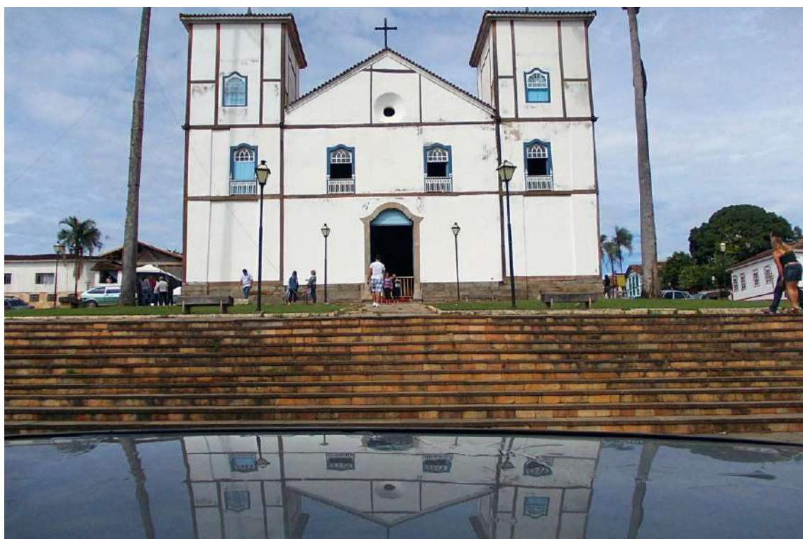
Ilustração1: Igreja Matriz de Pirenópolis – GO, 2012.

À tarde presenciei a chegada das tropas de cavaleiros na cidade. Era a chegada das folias. Nesse momento, muitas pessoas se posicionaram em frente às suas casas para ver passar um grupo enorme de pessoas montadas a cavalo. Na porta de algumas residências se formavam verdadeiras recepções, com comida, bebida e música. Na rua, alguns grupos realizavam churrascos acompanhados por som automotivo. Nesse momento, na rua próxima à Igreja Matriz se viu uma grande movimentação de pessoas e animais e a polícia local, apesar de estar presente, não esboçava muitas reações ao que acontecia.