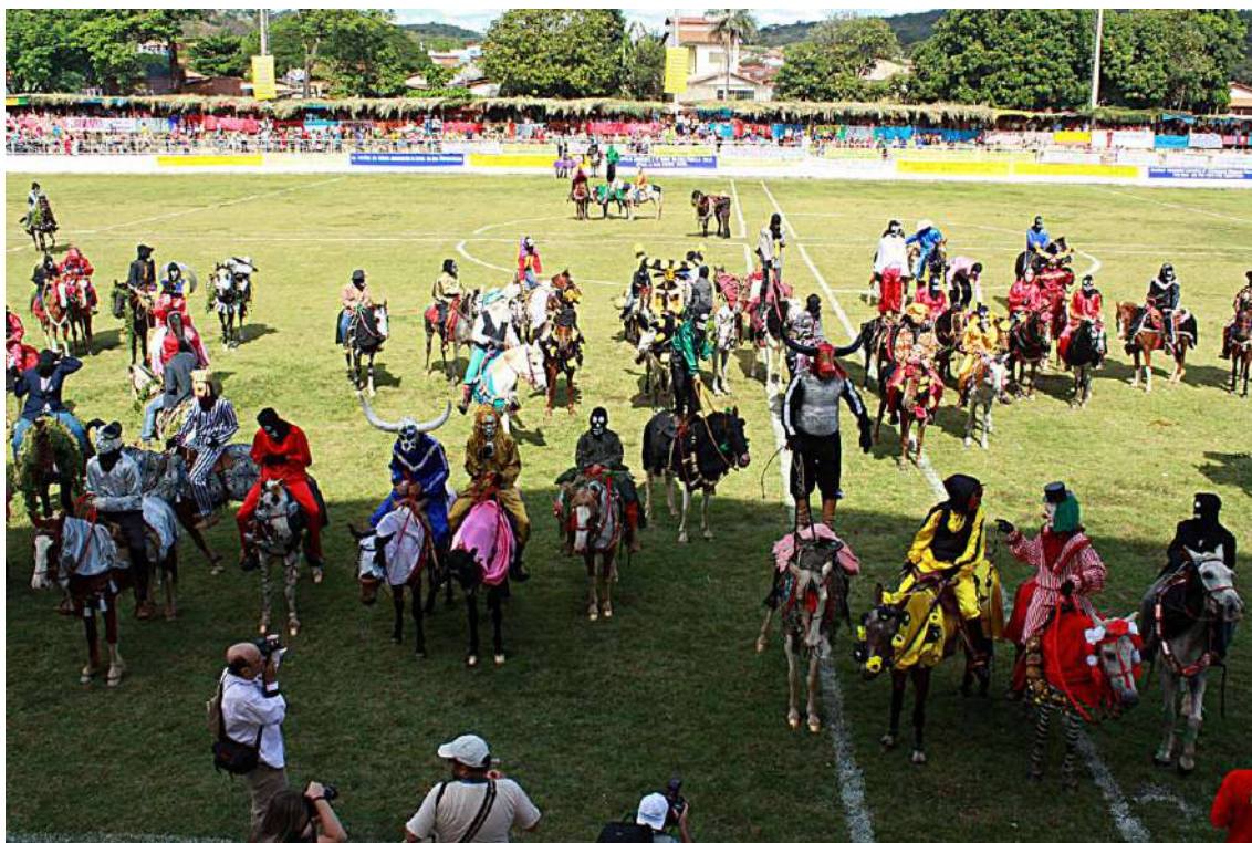
Ilustração 8: Mascarados durante o “Hino do Divino”. Pirenópolis - GO, 2012.

Quando solicitados a contar a respeito do contexto de início de suas participações como mascarados, os colaboradores revelaram que essa experiência é altamente sensorial, repleta de expectativa e que se apresenta como um corte na experiência, uma oportunidade de viver, mesmo que por pouco tempo, uma vida distinta da que se tinha normalmente. Fato interessante é que quando perguntados sobre qual idade tinham quando começaram, responderam prontamente, revelando que esse é realmente um fato marcante em suas vidas.