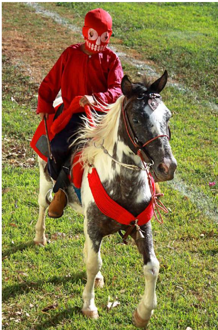
Ilustração 10: Pequeno mascarado no “Cavalcódromo”. Pirenópolis – GO, 2012.

de sua sociedade. E por meio dessa manifestação elas compreendem seu lugar no mundo. É isso que entendo quando Geertz apresenta seu conceito de cultura como contexto (GEERTZ, 2011, p.10).