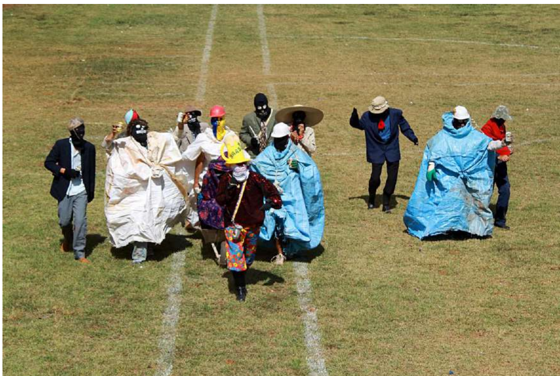
Ilustração 9: Mascarados desfilando no “Cavaldódromo”. Pirenópolis – GO, 2012.

Eu tinha dezessete anos, por aí. Era bom a liberdade. Era uma coisa... Era uma brincadeira inocente. Era uma brincadeira inocente e o sentido de liberdade, em termos de vida, tudo que a gente não fazia com a cara limpa a gente ia à forra fazendo com a máscara no rosto. (Joaquim*, 49 anos)