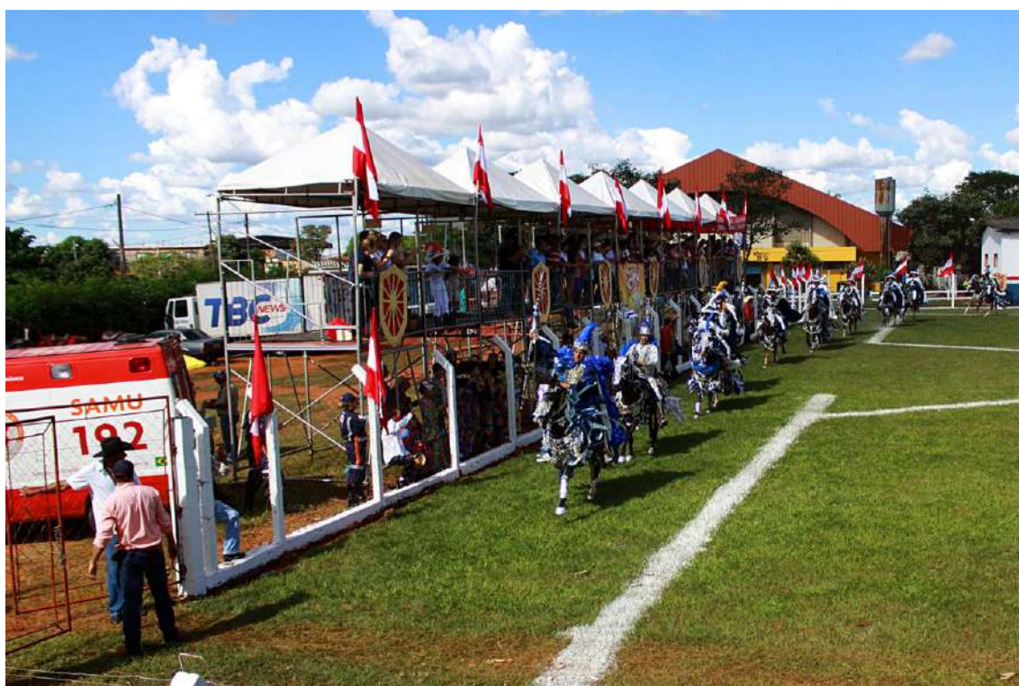
Ilustração 4: Camarotes no campo das Cavalhadas de Jaraguá – GO, 2012.

O campo de Cavalhadas, que há uma semana não apresentava estrutura de arquibancadas e camarotes, tinha agora outro aspecto. O campo é retangular, cercado por uma tela de arame trançado. Nos dois lados menores, um decorado em azul representando os cavaleiros cristãos e outro em vermelho, representando os mouros, foram construídos camarotes, altos, de metal e de estilo padronizado, que eram ocupados por autoridades e