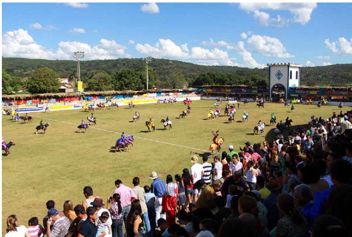
Ilustração 7: Vista do “Cavalhódromo” durante as Cavalhadas. Pirenópolis - GO, 2012.

O Cavalhódromo foi uma construção especialmente projetada para esse evento ritual, apesar de se apresentar como um espaço voltado a múltiplas funções. Com formato retangular, possui em seus dois lados menores torres altas destinadas a receber os familiares dos reis mouro e cristão. Abaixo, duas fileiras de camarotes construídos e decorados de forma independente pelas famílias. Nos dois lados maiores do campo se posicionavam as arquibancadas e acima delas mais camarotes.