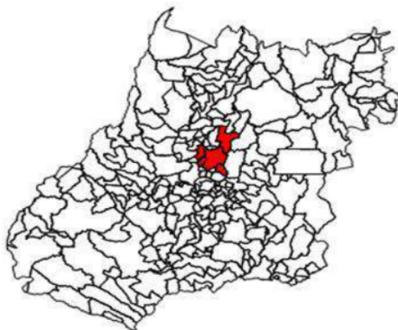
Figura 1 – APL Confeções da Região de Jaraguá: Municípios participantes