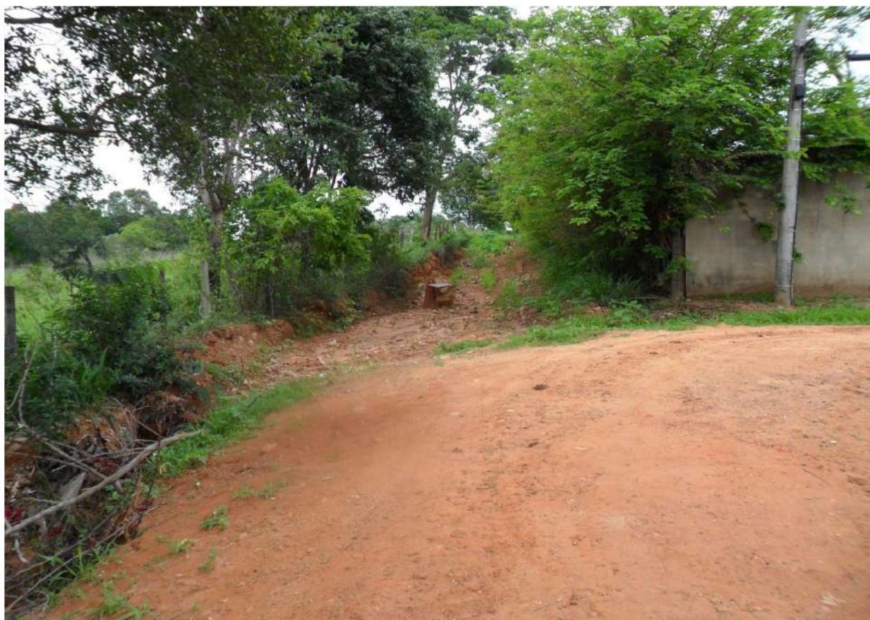
A rua de acesso ao Córrego continua do mesmo jeito... (2012)