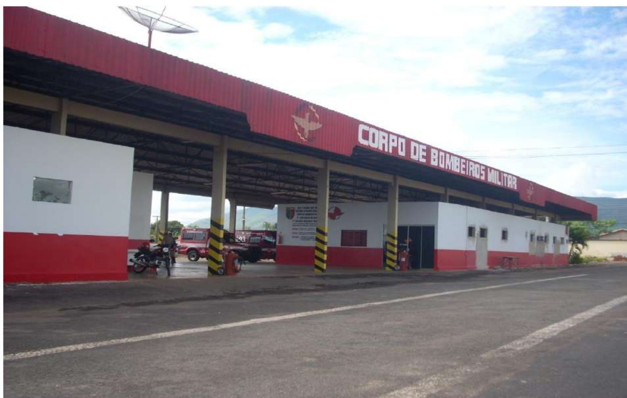
Outubro -2006/ Thiago Abdala de Moraes - Capitão QOC Comandante da 17ª CIBM