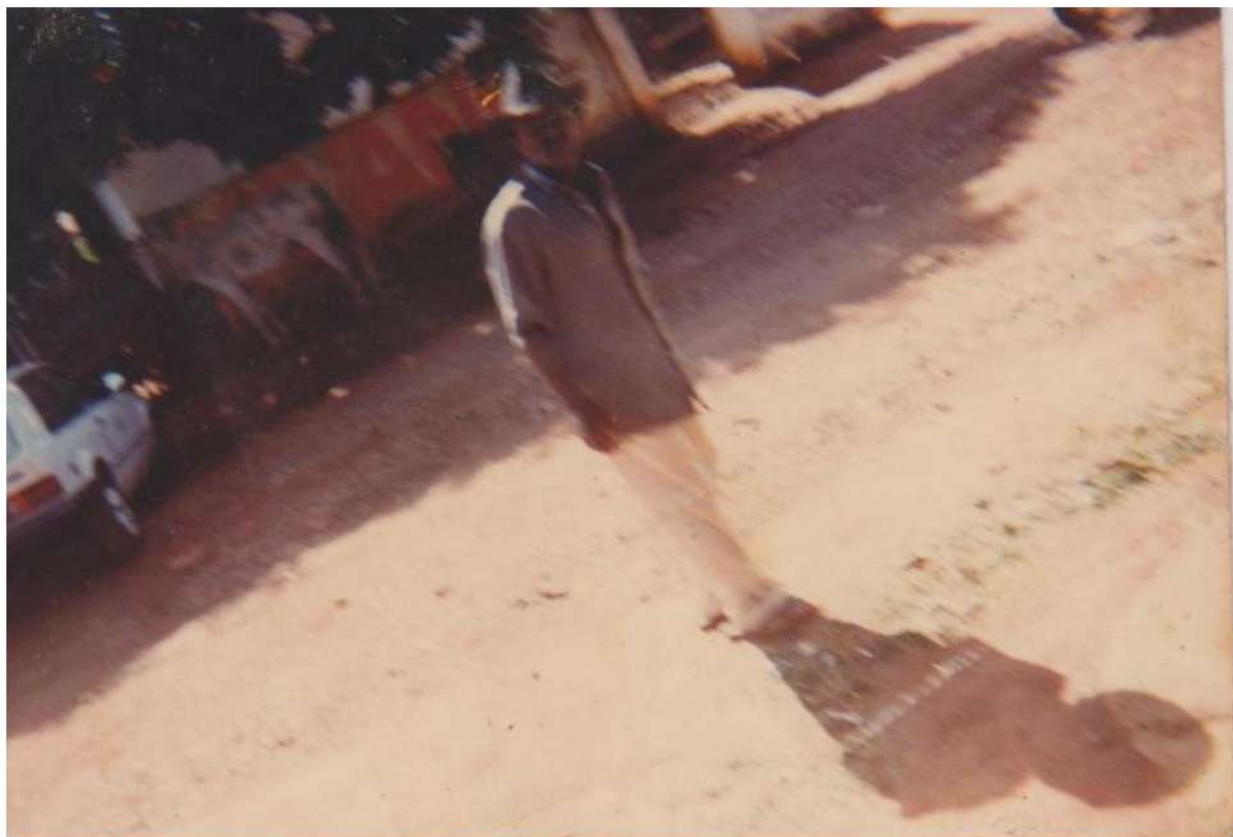
1995 - Rua Marquezine ainda sem pavimentação.