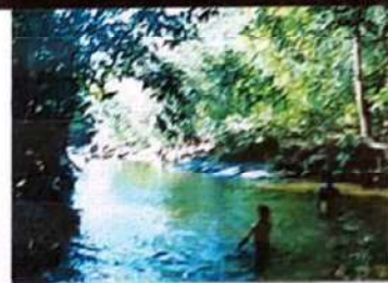
Rio do Peixe