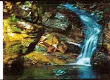
Cachoeira do Saraiva