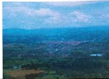
Poção da Serra