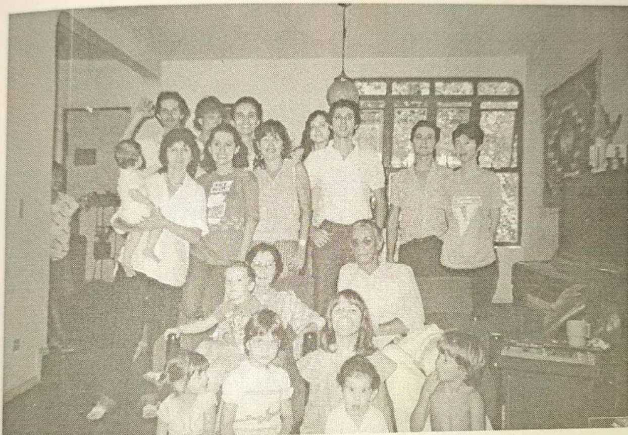
Família reunida, em janeiro de 1985.