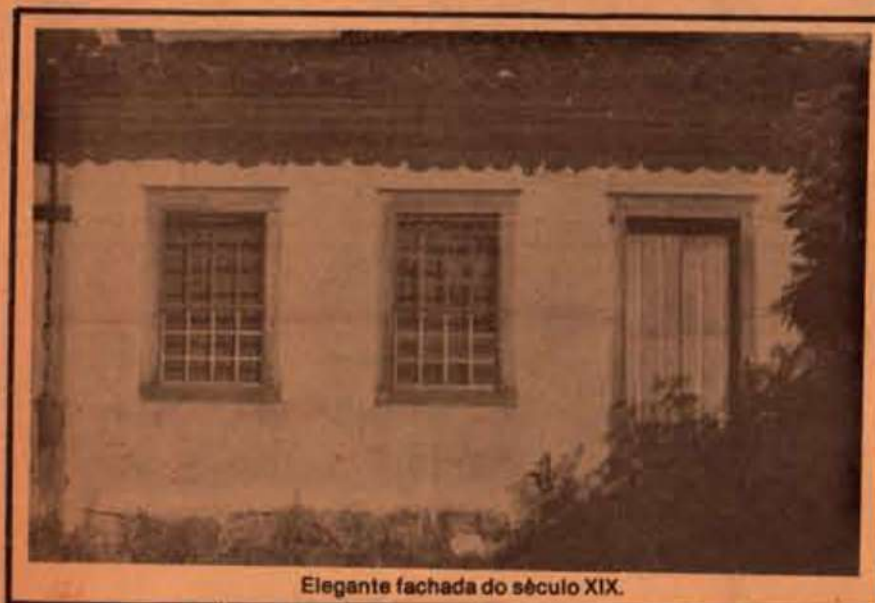
Elegante fachada do século XIX.

transformações econômicas e sociais que faltou, nesse grau de dinamismo, a muitas outras velhas cidades goianas. Jaraguá, morada final de Urbano do Couto, o esotérico inventor de roteiros de ouro, possui ainda alguns monumentos de importância. Alguns casarões e sobrados, suas duas igrejas barrocas — esses velhos repositórios que sob as largas tábuas do soalho guardam as ossadas e os sonhos das gerações que inventaram Goiás. E que o vão devorando, pelo efeito dessa macabra contabilidade de trocas reais e simbólicas que fazem a tecitura da História. Por exemplo, é certo que na década de 1940