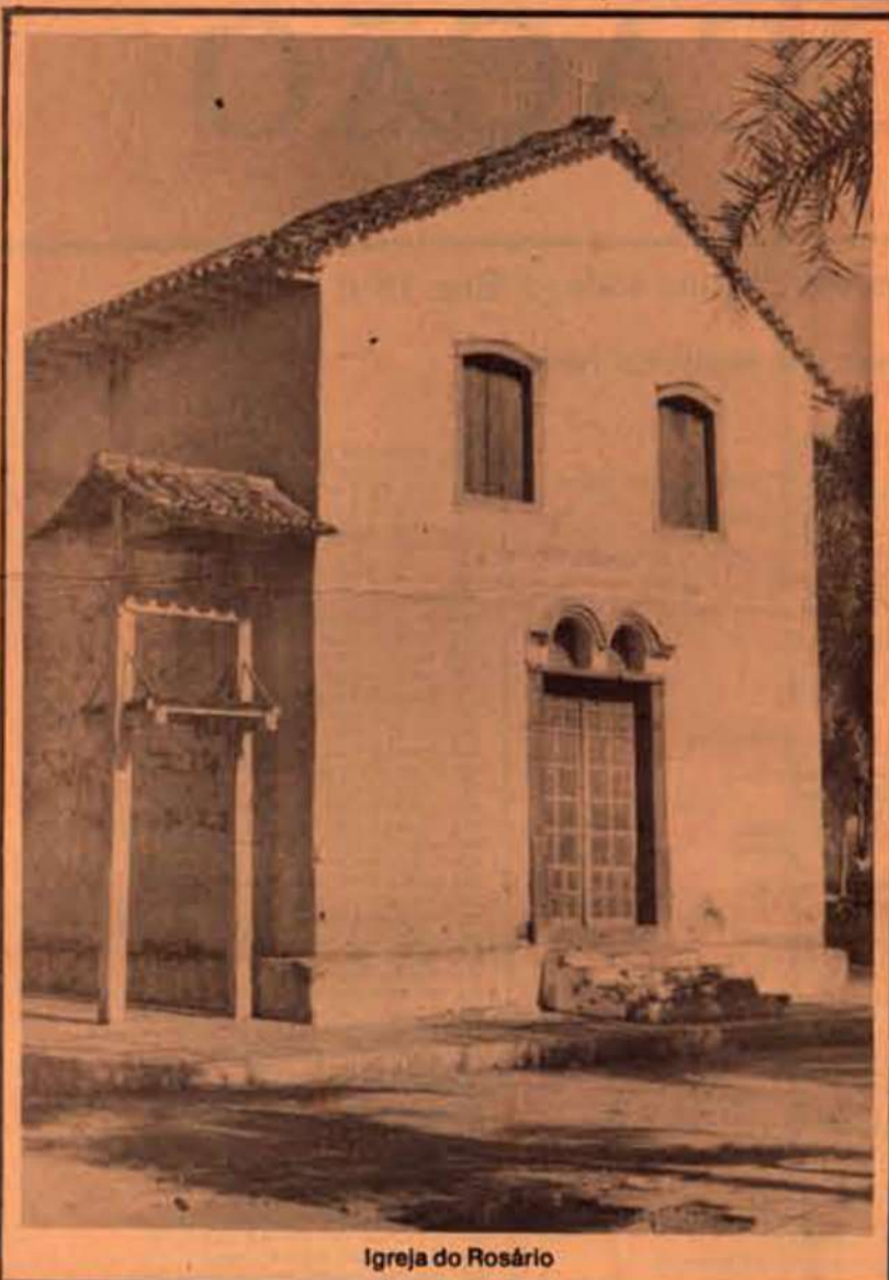
Igreja do Rosário