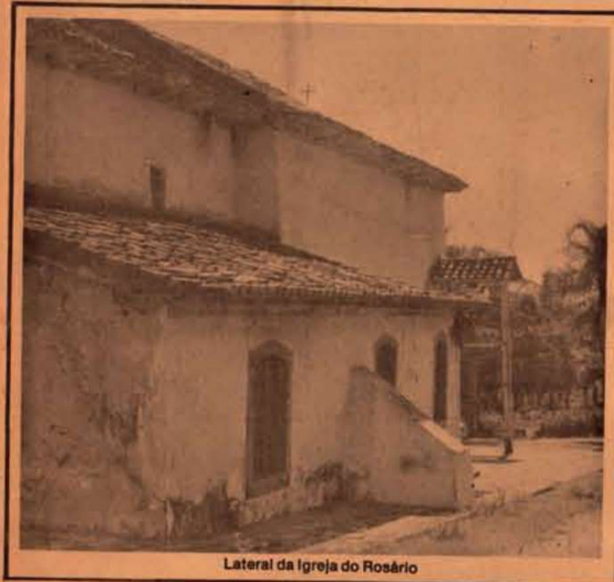
Lateral da Igreja do Rosário