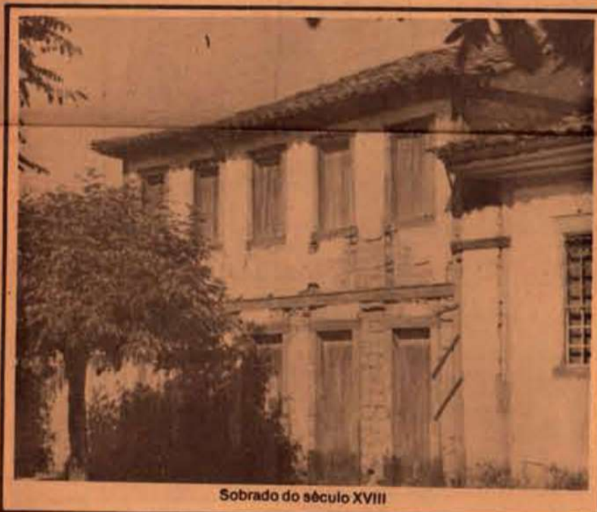
Sobrado do século XVIII