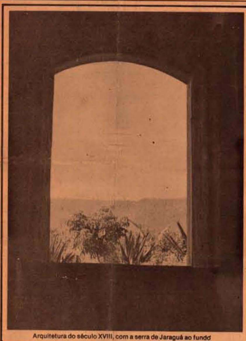
Arquitetura do século XVIII, com a serra de Jaraguá ao fundo