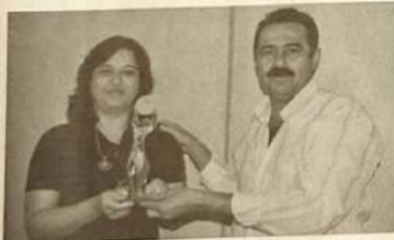
Goianésia conquista a Palma de Ouro, em SC, como uma das 100 melhores gestões na área de Educação no País

A educação que Goianésia dá aos seus quase 7 mil alunos da rede municipal de ensino está entre as 100 melhores gestões educacionais do Brasil, conforme seleção que avaliou os quase 6 mil municípios brasileiros.