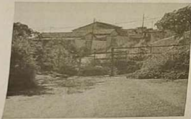
Moradores da cidade de Jaraguá têm cobrado da Administração Pública Municipal melhores condições no que diz respeito à prestação de serviços, que é de obrigação do município.

Uma grande parte da sociedade de Jaraguá tem demonstrado insatisfação perante os sinais incontestáveis de abandono em que a cidade se encontra. Não tendo a quem reclamar devido o prefeito não ser mais encontrado com facilidade no município, resta apenas a alguns moradores lamentarem a calamitosa situação em que se encontra alguns bairros da cidade.