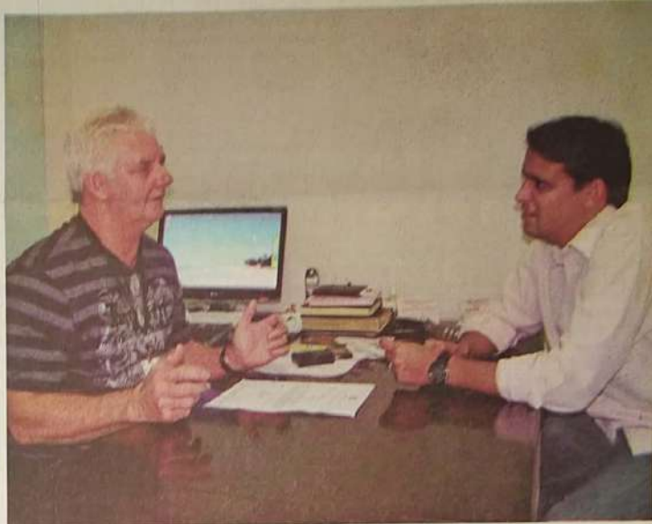
Quem esteve visitando o Diretor Presidente deste Jornal foi o Deputado Estadual Jaraguense Thiago Peixoto. Durante as longas horas de conversa informal entre os dois amigos, foram discutidas questões políticas, administração pública, candidaturas locais, governo, entre outras. Nesta visita Thiago Peixoto reinterou o seu compromisso com a cidade de Jaraguá, mesmo sem ter o apoio do prefeito. O Deputado disse que tem muito por fazer em Jaraguá.