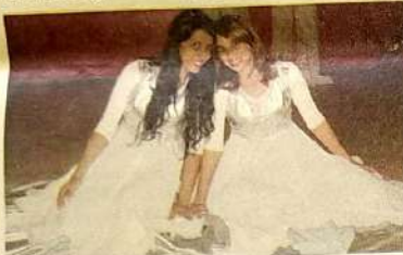
No último dia 22, a Igreja Verbo Vivo -campo de Jaraguá, realizou o culto em comemoração ao aniversário de 1 ano do Ministério de Dança Intimidade. Na ocasião a igreja ficou lotada e quem estava no culto participou de um belíssimo louvor ao vivo com o Ministério Verbo Aclamai e o Ministério de Louvor Chama da Adoração (todos de Jaraguá), que se uniram em prol de um louvor mais perfeito para Deus. Parabéns pela festa. O povo de Deus merece e necessita de eventos assim.