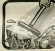
Não deixe a água da chuva acumulada sobre a laje.