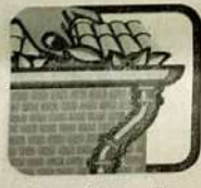
Remova folhas, galhos e tudo que possa impedir a água de correr pelas calhas.