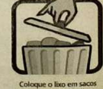
Coloque o lixo em sacos plásticos e mantenha a lixeira bem fechada. Não jogue lixo em terrenos baldios.