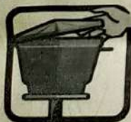
Mantenha a caixa d'água sempre fechada com tampa adequada.