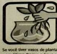
Se você tiver vasos de plantas aquáticas, troque a água e lave o vaso principalmente por dentro com escova, água e sabão pelo menos uma vez por semana.