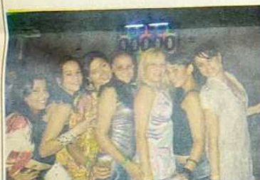
Uma bela pose das meninas mais bonitas da festa. Carisma e simpatia não faltou para elas. Sorte de quem faz parte deste grupo de amigas!!!