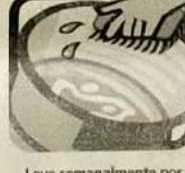
Lave semanalmente por dentro com escovas e sabão os tanques utilizados para armazenar água.