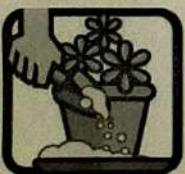
Encha de areia até a borda os pratinhos dos vasos de planta.