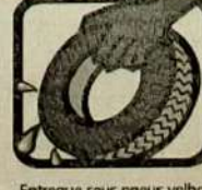
Entregue seus pneus velhos ao serviço de limpeza urbana ou guarde-os sem água em local coberto e abrigados da chuva.