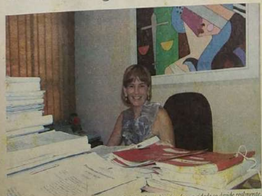
"Jaraguá foi bem mais complicado. Aqui, os ânimos são mais acirrados, a cidade se divide realmente. O processo começou acirrado, de ambos os lados. Por isso, logo no início já fez o Termo de Ajustamento de Conduta para evitar que a cidade se tornasse um caos com a propaganda política, cada vereador iria colocar o seu carro de som, os candidatos a prefeito iam colocar muitos carros e só quatro carros para cada coligação majoritária e a proibição da queima de fogos foi uma solução para dar tranquilidade à cidade. A situação mais incômoda foi fundamental."