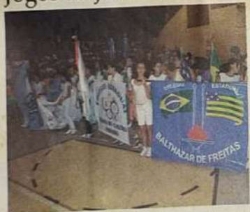
A Prefeitura Municipal de Jaraguá através da Secretaria Municipal de Juventude, Esporte e Lazer promove junto com as escolas públicas e particulares, a quarta edição dos Jogos da Juventude.