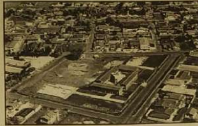
levantadas na formação de nossa história.

É um projeto ousado. Muito se tem feito e muito mais ainda a fazer. Mas o projeto avança à medida em que as pesquisas são feitas. Além de moroso, o trabalho de pesquisa histórica é doloroso diante da queda de certos mitos. Mas é gratificante diante de descobertas que fundamentam hipóteses