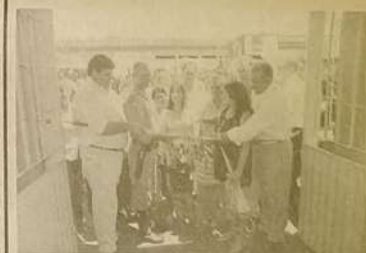
A comunidade recebeu também escolas municipais reformadas e com ampliações importantes