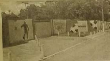
Área de lazer e diversão, Estádio e Pecuária foram recuperados para melhor atender à comunidade