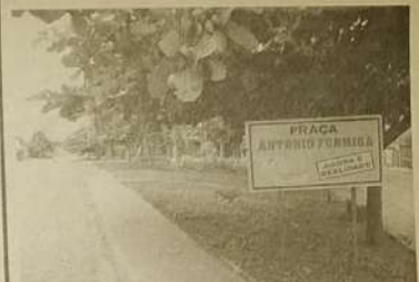
Praça Antônio Formiga, transformada de monte de lixo em local para passeio, descanso e atividades infantis