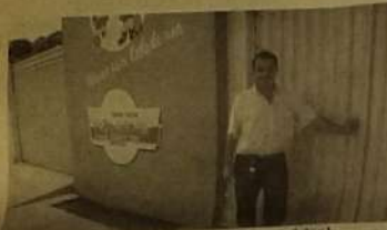
Projeto Belas ganhou estrutura física municipal totalmente reformada e com mobiliário novo