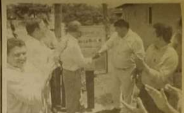
Vários metros quadrados de calçamento em bairros da cidade foram entregues à comunidade