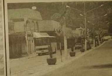
Avenida Cel. Tubertino Rios. Limpeza constante e revitalização do canteiro central