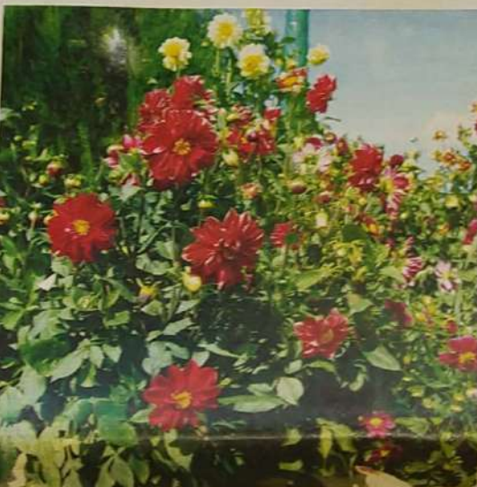
Flores plantadas em canteiros centrais da cidade. Visual novo custou trabalho e muita criatividade do secretário, para burlar os recursos escassos

Trabalho do secretário de desenvolvimento urbano dá novos ares à cidade