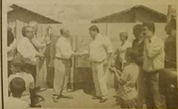
O vice-governador, Ademir Menezes, prestigiou a entrega de casas populares na região