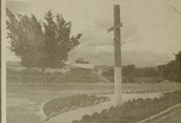
Recuperação do trevo e instalação de ponto de ônibus na Vila Isaura, saída para Itaguara