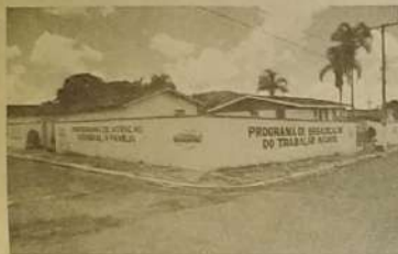
Reformados, prédios da PETI, CRAS e PAIS tem estrutura condizente com os programas desenvolvidos