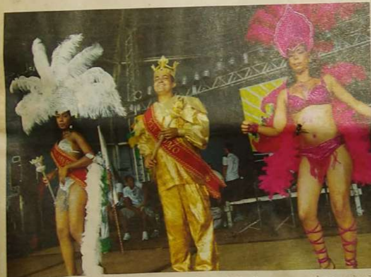
Carnaval 2008 abalou a avenida. Com um público de mais de 30 mil pessoas, segundo a organização do evento, nem a chuva atrapalhou a festa. Diariamente cerca de seis mil pessoas estiveram na área preparada na avenida JK para comemoração do evento. Público aplaudiu a mudança e quer mais. Página 09