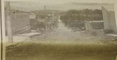
Ruas da Vila Natalina recuperadas com aproveitamento de asfalto da reforma da BR 153