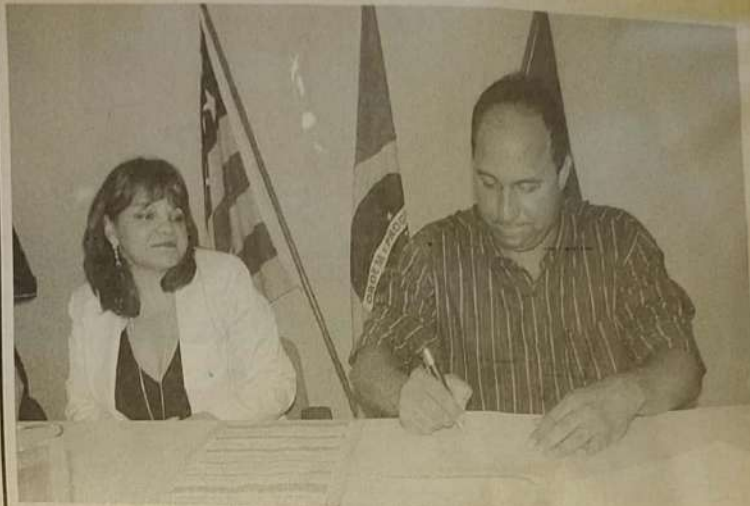
Prefeito Lineu Olímpio assina contrato de liberação de recursos com representante da Caixa Econômica Federal

Liberação de verbas, pela Caixa Econômica Federal, foi prestigiada pelo deputado federal Rubens Ottoni e por diversas autoridades locais. Dinheiro é proveniente de diversos ministérios do governo federal e dará um novo fluxo de obras para a cidade