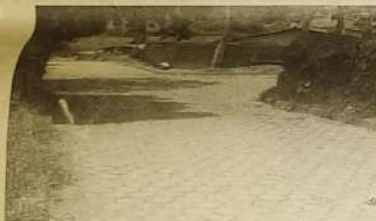
Pavimentadas com bloquetes, ruas ganharam charme e moradores, conforto com o fim da poeira e do barro