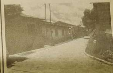
Beco "do Coró", próximo à feira coberta, recebeu calçamento com aproveitamento da obra do Coreto