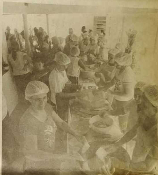
Voluntários lotaram a casa do prefeito Antônio Leonel para ajudar a fazer as mais de oito mil pamonhas que foram consumidas durante todo o dia pela comunidade.

O prefeito já é conhecido por fazer muitas confraternizações para os moradores de Itaguaru. "Em épocas de melancia ele compra um caminhão e coloca à disposição de toda a gente de Itaguaru, agora é o milho, então fez pamonha, está sempre buscando novas formas de alegrar