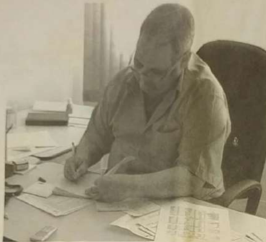
"Bastaria emendar no projeto original o que fosse necessário", resumiu o vereador