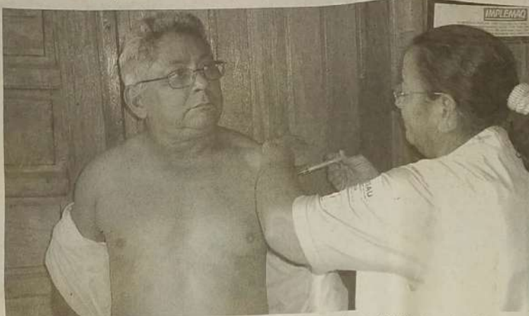
Vacina contra a febre amarela é eficaz e protege as pessoas contra a contaminação. Eliminar focos de proliferação de mosquitos também é uma atitude que evita a propagação da doença pela cidade