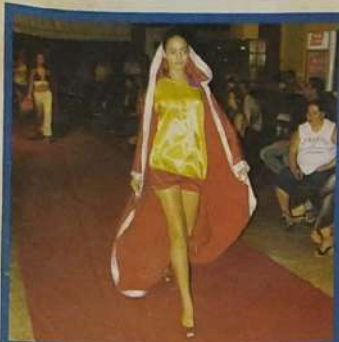
Desfile de formandos

15 de Dezembro de 2007 a 15 de Janeiro de 2008