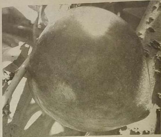
Insumos dolarizados aumentaram com o câmbio e as vendas, em real, não estão compensando o custo das lavouras de frutas no Brasil

Despesas Na Caliman, nos últimos três anos o custo de produção subiu 35%. "Só a despesa com mão-de-obra aumentou 90%". Já os gastos com insumos (fungicidas, herbicidas, inseticidas e adubação) cresceram