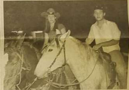
Toda comunidade participou da cavalgada que marcou o início das festividades de comemoração ao aniversário da cidade.