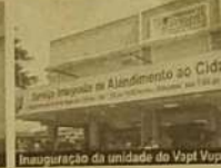
Inauguração da unidade do Vapt Vupt