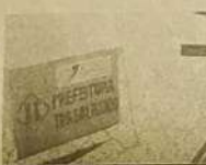
Asfaltamento do Setor Vila Verde