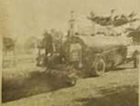
Asfaltamento do Povoado Monte Castelo

Várias obras já foram concluídas e outras estão em andamento. Saibam quais são!