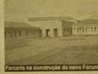
Parceria na construção do novo Fórum