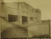
Construção do Centro Tecnológico da Moda