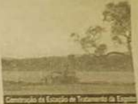
Construção da Estação de Tratamento de Esgoto