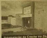
Inauguração da Creche V6 Zita