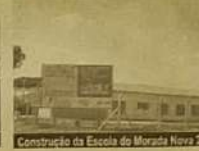
Construção da Escola do Morada Nova 2