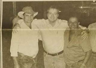
O prefeito foi prestigiado por autoridades como outros prefeitos e o deputado líder do governo estadual Helder Valim (centro).