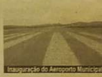
Inauguração do Aeroporto Municipal