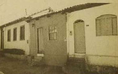
Os patrimônios acima sofreram descaracterização ao longo dos anos, vítimas de falta de políticas de preservação