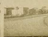
Asfaltamento do Setor Morada Nova 2