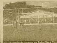
Inauguração do campo do Setor Vera Cruz