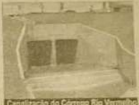
Canalização do Córrego Rio Vermelho