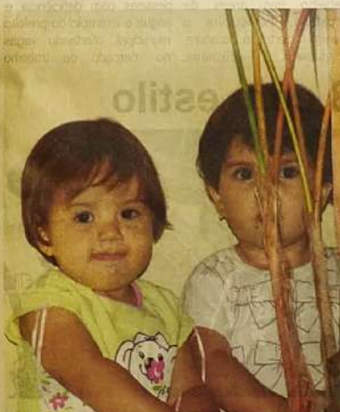
Jovens torcedoras. Estas belas meninas foram flagradas em uma confraternização do Jaraguá Esporte Clube, filhas de membros da diretoria ou de jogadores do time. Com certeza, não são espíãs e devem agitar seus pompons na hora de torcer pelo time dos papais.

O evento de abertura do escritório do governador Zecão contou com a presença de representantes de 48 municípios da região LB2, que compreende os estados de Goiás e Tocantins, região onde atuará o novo governador do Clube Lions. O governador trouxe bandas marciais, promoveu desfiles e grandes palestras e grupos de trabalhos para discutir temas pertinentes aos trabalhos sociais do Lions. Também foi lançada a pedra fundamental de um hospital oftalmológico que será construído na cidade, administrado pelo Lions em seu objetivo de acabar com a cegueira do mundo.