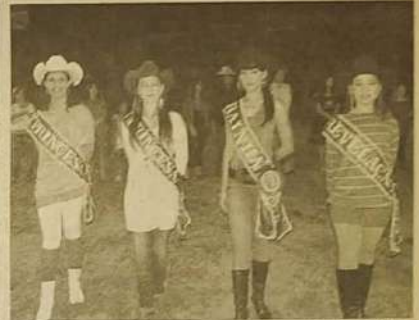
Eleitas por sua beleza, quatro jovens representaram a cidade como rainha, princesas e revelação.