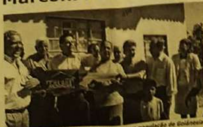
Marconi e Otávio entregando obras para a população de Goianésia

O governador Marconi Perillo esteve a poucas semanas em Goianésia entregando obras para população. Na ocasião várias autoridades compareceram como o secretário de cidades Ademir Menezes. O prefeito Otávio Lages Filho preparou uma grande recepção ao governador. Marconi visitou obras em andamento, posou junto a alguns mestres de obras, tomou café com políticos e a população. Vários deputados da região estiveram prestigiando o prefeito. O governador também convidou vários prefeitos aliados como o