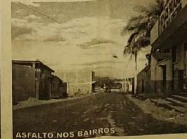
ASFALTO NOS BAIRROS

Numa parceria inédita em Jaraguá a prefeitura está fazendo junto com os moradores o asfalto do setor Vila Verde, num exemplo claro que o progresso também pode surgir da parceria público/privada.