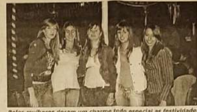
Belas mulheres deram um charme todo especial as festividades