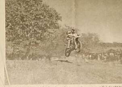
A tradicional corrida de Moto Cross mais uma vez foi destaque