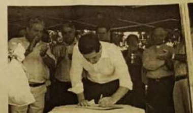
Governador Marconi Assinando Convênio