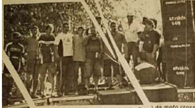
Na podium, vencedores receberam as premiações do moto cross