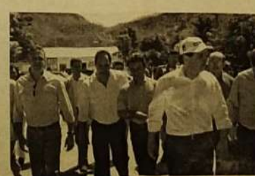
Caminhada das autoridades