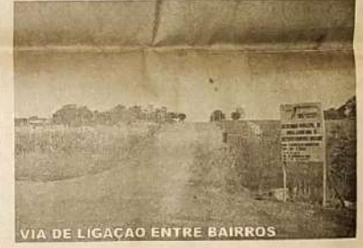
VIA DE LIGAÇÃO ENTRE BAIRROS

importante é a revitalização do trevo sul, uma obra que definitivamente está mudando a cara de Jaraguá e deixando nossa cidade mais bonita. Isto trará um retorno extraordinário para população é a futura pista