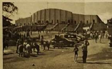
Catedral de Muquém