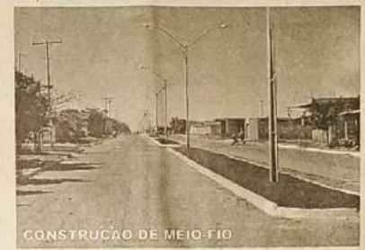
CONSTRUÇÃO DE MEIO-FIO

trabalho deixarão seus filhos na creche. O Centro Poliesportivo já é uma realidade, em breve será entregue um complexo com espaço para a prática de vários esportes como futebol society, quadras de areia, pista de skate e muito mais. A