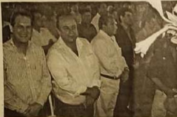
Autoridades do Governo