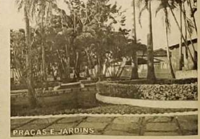
PRAÇAS E JARDINS

final. Além disso, vários bueiros já foram colocados para fazer a ligação de estradas e ruas, a recuperação de pontes tem sido uma preocupação constante. Algumas praças como a do cemitério Santana foi