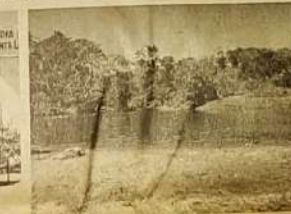
Crianças prestigiando a festa, capela de Lagolândia um dos pontos mais visitados e o belo manancial de águas que é admirado pelos turistas