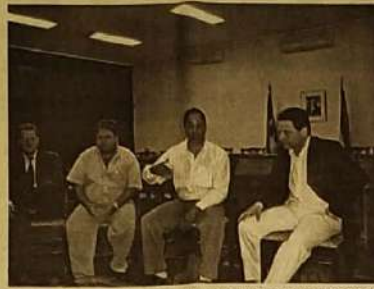
Em reunião com lideranças governador garante a CASEGO.

Desde que Jaraguá se tornou pólo de confecções, a grande preocupação dos confeccionistas está em como vender o que é fabricado. Muitos empresários entregam seus produtos em feiras e lojas de Brasília. Outros têm seus representantes espalhados por alguns estados do norte e nordeste, mas, poucos têm sua própria loja. Há cerca de seis anos o governador de Goiás Marconi Perillo fez um compromisso com os empresários jaraguenses de doar o prédio da CASEGO para que nele fosse construído o Shopping das Confecções de Jaraguá. Um estudo do