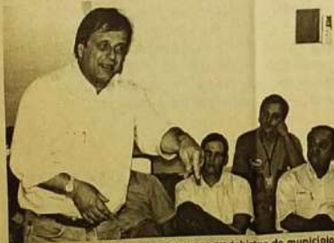
Adib em discurso de pré-candidato para pmdebistas do município

Adib Elias, prefeito de Catalão, cidade do sudoeste goiano, visitou a cidade de Jaraguá no último dia 29 de julho. Adib é pré-candidato do PMDB ao governo de Goiás no próximo ano. A reunião em Jaraguá faz parte da estratégia de Adib para convencer cada diretório sobre sua possível candidatura majoritária. A reunião aconteceu na