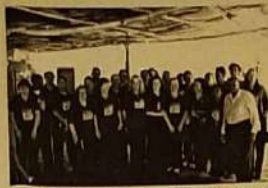
Coral da SANEAGO e os fiéis que acompanham celebração na capela de Lagolândia