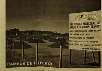
CAMPOS DE FUTEBOL

Dessa forma mais um bairro irá sair da poeira para ganhar definitivamente sua valorização. Outros projetos de asfaltamento em outros bairros já estão em fase final. Uma das promessas que já