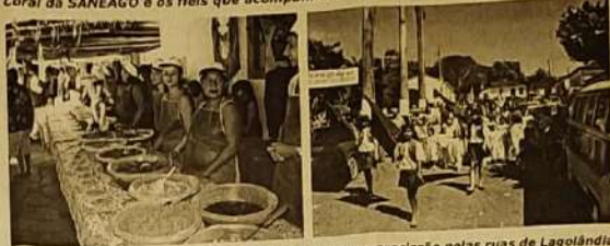
Distribuição de vários tipos de doces aos visitantes e procissão pelas ruas de Lagolândia