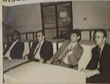
Prefeito e integrantes de Mesa. Pública no lançamento do Orçamento participativo

Começou a ser discutido em Jaraguá o orçamento participativo. O orçamento participativo possui um caráter público não só por ser uma lei, mas também por ser elaborado e aprovado num espaço público, através de discussões e emendas feitas pelos vereadores nas sessões da Câmara. A Constituição de 1988 define três instrumentos integrados para a elaboração do orçamento, que visam o planejamento das ações do poder público. São eles: Plano Plurianual (PPA): prevê as despesas com programas, obras e serviços decorrentes, que durem mais de um ano. No primeiro ano de governo, o prefeito deve propor diretrizes, metas e objetivos que, após aprovação, terão vigência nos próximos três anos de sua gestão e no primeiro ano da gestão