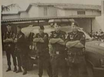
Jaraguá agora conta com destacamento da GPT

Dia 20, segunda-feira, iniciou em Jaraguá o GPT (Grupo de Patrulhamento Tático). O GPT é um grupo que realiza um patrulhamento rotineiro nas ruas, é tático, pois, exige tática de ação. O grupo integra policiais fortemente armados que estão preparados para o combate a roubo a banco, lotéricas, rebelião em presidio, troca de tiros, seqüestro, rebeliões, furo de bloqueio de patrulhamento e situações onde se usam armas, bombas, etc.