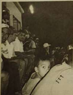
Expectativa de pelo menos 2 mil pessoas nas finais

Definidos os finalistas do campeonato municipal de futebol. Na série B (2ª divisão) irão fazer a final