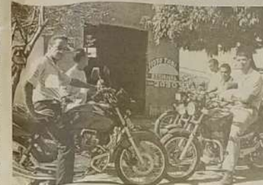
Na lei só pode haver 4 pontos de moto táxi

Desde que o Jornal O Regional publicou que o poder executivo tem a intenção de limitar o número de moto-táxi algumas reuniões aconteceram para debater o assunto. Um ex-moto taxista procurou nossa redação para nos apresentar a lei nº 699 de 06 de dezembro de 1999 que dispõe sobre o funcionamento dos pontos de moto táxi na cidade. De acordo com a lei a competência para fiscalizar e coordenar os moto taxistas é da SMT (Superintendência Municipal de Trânsito), sendo que é intransferível a permissão concedida. Somente pessoas jurídicas poderão pleitear a exploração do serviço, sendo que essa autorização concedida pela SMT deverá ser em forma de alvará. A lei pede que todos os moto taxistas estejam com a documentação em dia, e estar com o emplacamento no