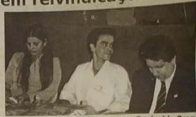
Dep. Laudeli Lemos e o centro Genivaldo Braz

Os agentes de saúde de Jaraguá se reuniram no último dia (04/07) para deliberarem sobre alguns assuntos, como melhorias em suas condições de trabalho, incluindo a reivindicação de aumento salarial. A cerimônia foi realizada na Associação Atlética Banco do Brasil. A deputada estadual Laudeli Lemos (PSDB) que compareceu encampou luta em defesa dos agentes de saúde. Conforme frisou em seu discurso, disse estar inteira disposição dessa categoria. A medida que o processo de municipalização das ações de saúde vem ocorrendo, ao Estado cabe o papel de coordenação das atividades, manutenção de serviços especiais, como os laboratórios de Saúde Pública, supervisão das atividades executadas em nível municipal. Hoje os agentes de saúde são considerados o alicerce dos PSFs (Programa de Saúde da Família). O Agente Comunitário de Saúde tem uma inserção importante, no processo de reorientação no modelo de assistência, uma vez que ele está integrado ao Programa de Saúde da Família.