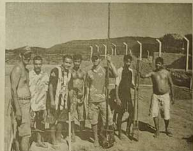
Atletas da região em mutirão no campo

Essa área onde está sendo feito o campo ainda precisa ser regularizada, a princípio, se comentou que teria que se enviar um projeto para câmara mudando o local que é área verde, para a área regulamentada para construção de campo de futebol. Mas segundo um assessor do prefeito, caso o local seja área verde basta um decreto do prefeito chamado "desafetação da área"