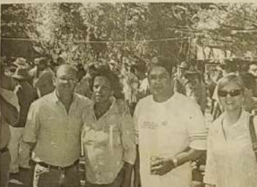
Prefeito Rogério prestigiando festa de Caxambu

Pirenópolis é uma cidade conhecida de todo o Brasil e de vários países do exterior por suas festas e tradições. Além das festas realizadas na cidade conhecidas e apreciadas pelo grande público, há ainda aquelas realizadas nos povoados que, por sua vez, também têm festas próprias. Há poucos dias o povoado de Caxambu realizou a sua festa louvando ao Divino Pai Eterno. Quase 20 carros de boi se reuniram para um almoço a beira do córrego