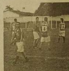
Times dos Compadres foi ao tapetão para continuar no campeonato municipal

jogo que causou estranheza foi entre Vila Isaura e os Compadres (Clube dos Vintês) onde a equipe dos Compadres tentou um acordo com a diretoria de esportes, devido a isso a equipe dos Compadres viajou por causa do feriado de Corpus Crísti, por diversos motivos como pescar, visitar familiares, etc. Quando a equipe dos Compadres retornou a polêmica já estava formada, muitos pediram a eliminação do clube. Na partida apenas três atletas do time dos Compadres compareceram a campo para enfrentar o time da Vila Isaura. Devido falta de jogadores das duas equipes para iniciar a partida o árbitro, optou por dar um W x 0 em favor do time da Vila Isaura uma vez que o time estava praticamente completo. A partir daí uma série de informações desencontradas provocaram vários ofícios, ora pedindo exclusão do time dos Compadres do campeonato, ora defendendo a permanência do time na competição. Dentro desses ofícios um deles feito pela Vila Aparecida time com zero ponto que queria ocupar a vaga que seria deixada pelo time dos Compadres. Eles pediram a exclusão dos Compadres do campeonato com base no artigo 14º do regulamento. Numa mancha incomum, pois o artigo 14º fala sobre o uso de chuteiras. Mas o mais grave é que esse ofício foi arquivado por várias equipes