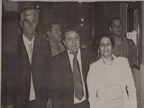
Prefeito empossado Watson Gama ladeado com vice-prefeito e primeira dama