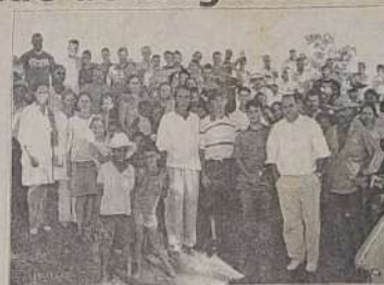
Mutirão da saúde levada aos sem terra.