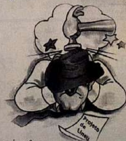
Charge do mês