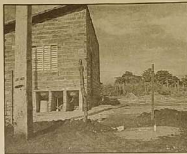
Construção feita em local inadequado

Moradores do bairro Primeira Etapa Morada Nova estão enfrentando um duro dilema: autorizados pela ex-prefeita Márcia, construíram casas irregulares, que invadem os limites da rua que foi projetada e podem ser obrigados a demolir as construções a qualquer momento.