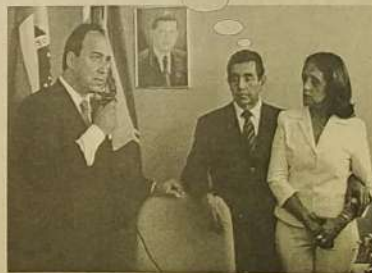
Momento da transmissão de Cargo

Ah... se eu soubesse discursar assim. Com certeza minha política estaria garantida por mais alguns anos.