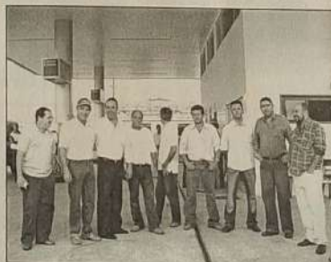
Amigos empresários em visita ao posto.