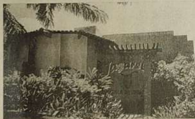
Fachada da escola

Objetividade e criatividade são características marcantes da Tagarela, possuidora de um espaço dinâmico e funcional, contando com laboratório de informática, fita de vídeo à disposição dos alunos, sala de aula ampla e bem aproveitada transformando o ambiente escolar em um local aconchegante, descontraído e alegre. Dirigida pela professora Lúcia Gonçalves de