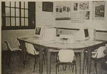
Sala de Informática