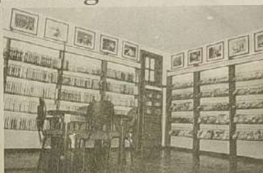
Sala de Vídeo

Escola de Inglês Tagarela - o inglês encontrado em um