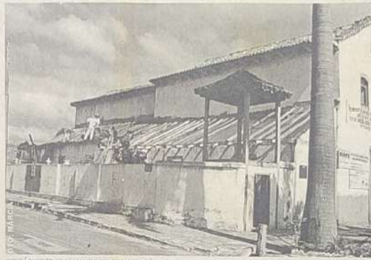
OPERÁRIOS TRABALHANDO NA FINALIZAÇÃO DA RESTAURAÇÃO DA IGREJA NOSSA SENHORA DA CONCEIÇÃO

Restauração da Igreja Nossa Senhora da Conceição está em fase final.