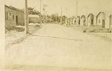
Jardim Morada Nova

Na edição passada o jornal O Regional publicou a denúncia dos moradores do Jardim Morada Nova que reivindicavam várias ações da administração pública. Eles agradecem as ruas patroladas e lembram que as fossas ainda estão abertas e falta a iluminação ser concluída.