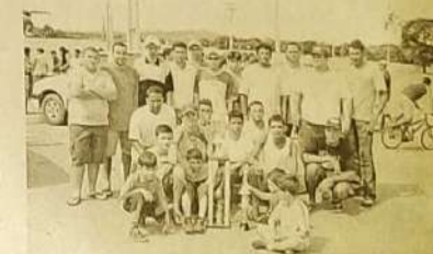
1º lugar do futsal (Revisão/Terra Santa) comemora com torcedores.