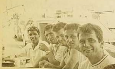
O alinhamento na foto, também representa o alinhamento de forças entre os jovens empresários, que buscam na amizade encontrar boas soluções empresariais e políticas.