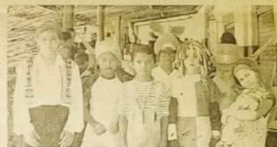
Turma do Sítio do Pica-pau-amarelo