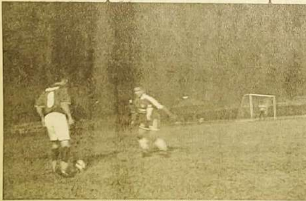
Jogo entre Milionários e V. Isaura A

Está primeira fase do campeonato Jaraguense foi um sucesso de público e de gols, foram assinalado 343 gols, uma verdadeira festa dos artilheiros, os torcedores que compareceram em campos saíram satisfeitos, mas nem tudo que reluz é ouro, tivemos partidas ruins onde só um time jogou, um exemplo foi na partida entre o Posto Jaraguá 20 x 1 Embratel, isso sempre acontece no início do campeonato amadores, porque