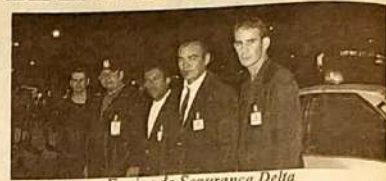
Equipe de Segurança Delta

Com a retirada do carnaval da Praça do Coreto não foram poucas as críticas de alguns comerciantes (lanchonetes) que sempre enriqueceram com o carnaval que a prefeitura bancava sozinha e alguns políticos que não tem voto nem mesmo para se eleger a vereador, entraram na onda do protesto, compraram um caixão e desfilaram com o mesmo pelas ruas simbolizando o enterro do carnaval. Acabaram numa tremenda rressaca e num grande desapatamento.