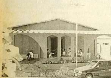
Prefeitura Municipal de Carmo do Rio Verde

A Prefeitura Municipal de Carmo do Rio Verde mudou de endereço. O antigo