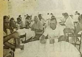
Garis saboreando o delicioso almoço.