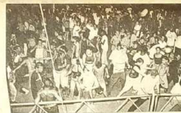
Foliões na maior animação

Não é de hoje que o carnaval de Goianésia vem crescendo e se destacando em Goiás. Mas com a união empresarial que existe naquela cidade não poderia ser diferente. A festa em si ocorre na Av. Goiás, como já é tradição, pois desde quando foi criado, o carnaval sempre aconteceu na mesma avenida. O Carnaval deste ano teve um total de gastos de R$ 80.000 (oitenta mil), sendo R$ 15.000 (quinze mil) por conta da Prefeitura Municipal, o restante foi conseguido com a união de