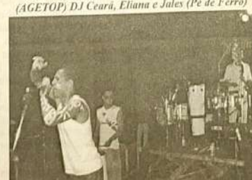
Banda Banana com Cevada agitando a galera que aprovou o show.