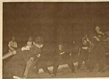
Grupo Evangelístico GARRA

Esteve em Jaraguá o grupo Evangelístico GARRA, proveniente de Goiânia que nasceu e floresceu na Igreja Ministério Novo Horizonte e já está na estrada há três anos. Este grupo já visitou alguns países como Argentina, Peru e vários estados brasileiros falando do amor de Deus de forma