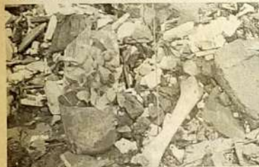
Ossos humanos jogados à céu aberto