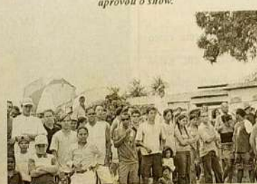
Foi grande o público que compareceu na manhã do Domingo de Carnaval para assistir as manobras dos Jeepeiros e Gaioleiros de Jaraguá.