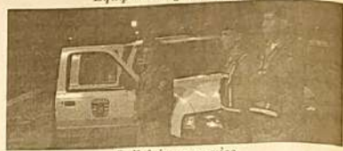
Policiais em serviço. SEGURANÇA

Para se ter uma idéia foram feitas 27 detenções no Carnaval de 2003. No Carnaval de 1993 foram 87 detenções. Isto prova que o Carnaval na Praça do Coreto tinha grandes investimentos em segurança sem muitos resultados. Já no parque investiu-se menos e a segurança foi elogiada por todos.