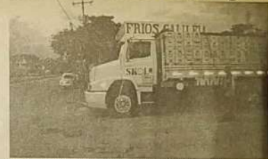
Um dos exemplos mais comuns em nosso trânsito é cenas como esta.

Por falta de atuação da Secretaria Municipal de Trânsito (SMT) o trânsito de Jaraguá vai de mal a pior, muitas ruas mudaram de sentido, exemplo disso é que as ruas que eram de mão dupla, passou a ser de mão única. Por falta de divulgação, os motoristas que passam nessas ruas a anos, nem perceberam que havia uma placa indicativa informando, que a rua havia mudado de sentido, e acabou sendo multado. Outra infração gritante em nossas ruas são caminhões que estacionam bem nas esquinas não respeitando os 5 metros previsto no código de trânsito atrapalhando a