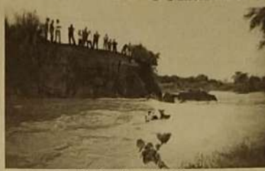
Rio Vermelho na BR - 153.

A forte chuva que caiu em Jaraguá no último dia 15 de janeiro, causou a interrupção da Belém-Brasília (BR-153) entre o trevo Norte e Sul da cidade, sendo esta a principal rodovia de ligação entre os Estados de Goiás e Tocantins, com o transbordamento do rio vermelho, o grande volume de água, abriu a já precária tubulação metálica (bueiro) que sustentava o asfalto, levando cerca de 15 metros da pista.