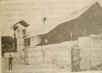
Cobertura protetora da Igreja Matriz de Pirenópolis

A Igreja Matriz Nossa Senhora do Rosário de Pirenópolis que pegou fogo no ano passado, e tombada pelo Patrimônio Histórico Nacional, ela recebeu no