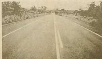
A reconstrução do asfalto da GO-080 recebe elogios dos motoristas.

A rodovia que liga Jaraguá a Goianésia foi construída na gestão do ex-governador Otavio Lage a mais de 30 anos, desde aquela época os 52 quilometro que separa as duas cidades nunca havia passado por nenhum recapeamento. No final do ano passado a GO-080 foi reconstruída pelo governo estadual, através da AGETOP, a rodovia agora conta com acostamento, é esta totalmente sinalizada para segurança dos motoristas, as pessoas que trafegam pela GO-080 não tem poupadro elogios ao trabalho realizado.