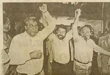
Lula ao lado de Britzola e Mário Covas (in memoriam) na luta pelas diretas já.