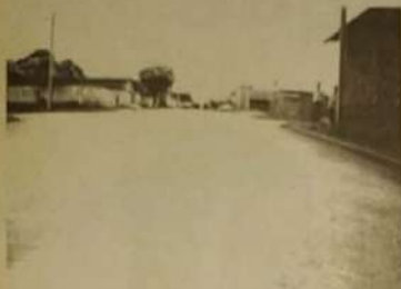
Asfalto do Setor Itaguá

Foi concluído pela prefeitura municipal de Itaguaru o asfaltamento de 14.000m 2 , que já está beneficiando os moradores do setor Itaguá. Esta obra foi realizada numa parceria da prefeitura de Itaguaru com o Governo do Estado dentro do programa asfalto novo, nesta obra também já está concluído o meio-fio de todas as ruas asfaltadas do bairro, num total de 2800 metros lineares, concluído com recursos da própria prefeitura municipal Itaguaru.