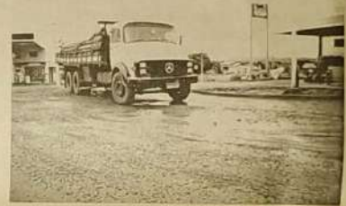
Estreco das ruas