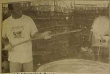
Processo de fabricação de Rapadura, um dos doces mais tradicionais.

A rapadura é um dos doces mais populares e consumidos do país há centenas de anos, para não deixar essa secular tradição brasileira se perder no tempo, a prefeitura municipal de Coacalzinho criou incenti-