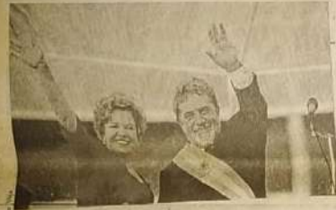
Lula com a sua esposa Marisa Leticia após receber a faixa presidencial.

Foram mais de vinte anos de lutas e quatro tentativas e lá estava ele recebendo a faixa presidencial, quebrando o protocolo, se atrapalhando em alguns detalhes, nervoso, o dia foi esperado de mais, sonhado de mais para não ser diferente. Foi uma festa e tanto. Uma festa para o mundo ver e para os partidários do PT irem a forra, se deliciarem com a conquista do palácio do Planalto como se fosse a conquista de uma guerra. Foi como se dissessem, o governo agora não pode mais mandar a polícia dispersar nossos movimentos com casseteles e granadas, porque o governo agora somos nós e a polícia está sob nosso comando. Numa análise mais profunda o pensamento é que nem haverá mais movimentos, mais greves, mais conflitos porque o LULA chegou