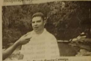
Dir. Ricardo Pereira Camargo

distância aproximada de 9 (nove) km, pois acreditamos que grande parte dessa extensão tenha sido contaminada. Mas eu acredito que esse tempo não será suficiente para a limpeza e recuperação de toda área contaminada".