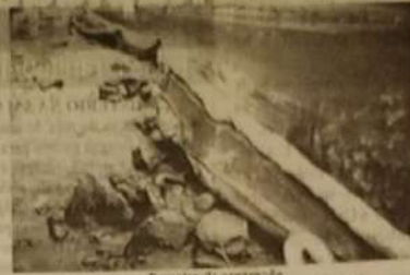
Barreira de contenção

No último dia 23 de dezembro por volta das 19:00h, uma carreta que transportava material poluente "piche" desgovernou e tomboou na GO-080, que liga Jaraguá a Goiânia nas proximidades do córrego Saraiva. No acidente houve rompimento do tanque transportado e o derramamento de aproximadamente 20.000kg (vinte toneladas) do produto, contaminando assim vários m2 do solo (serrado) até alcançar o córrego contaminando água, fauna e flora por vários km.