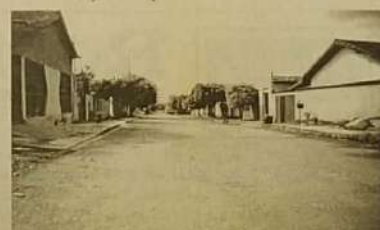
Bairro Vila do Sol