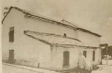
Última imagem da Igreja do Rosário, antes de começar a restauração.

As obras de recuperação e restauração da igreja Nossa Senhora do Rosário, começaram no início de agosto do ano passado e estão um pouco atrasadas em função das chuvas, mas devera ser concluída no final de fevereiro, se as chuvas colaborarem, a igreja foi construída no século XVIII e estava em situação precária, ao ponto de quase desabar, após avaliação do IPHAN (Instituto do Patrimônio Histórico Nacional) providências foram tomadas e os recursos apareceram, vindo um patrocínio de 90 mil reais