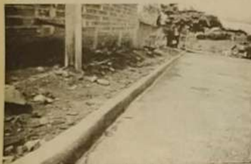
Meio fio do Setor Itaguá.

Foi concluído pela prefeitura municipal de Itaguaru o asfaltamento de 14.000m 2 , que já está beneficiando os moradores do setor Itaguá. Esta obra foi realizada numa parceria da prefeitura de Itaguaru com o Governo do Estado dentro do programa asfalto novo, nesta obra também já está concluído o meio-fio de todas as ruas asfaltadas do bairro, num total de 2800 metros lineares, concluído com recursos da própria prefeitura municipal Itaguaru.