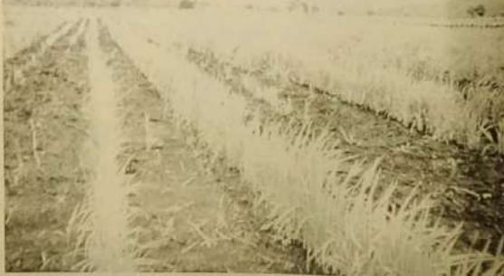
Lavoura Comunitária Aeroporto

A Prefeitura de Jaraguá, através da secretaria Municipal de Agricultura e meio Ambiente, plantou 91,2 ectares em lavoura comunitária.