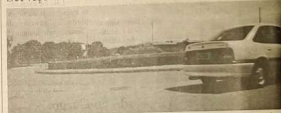
Rotatória da Vila Colombo foi construída sem autorização da SMT e agora causa transtornos aos motoristas.

A secretaria municipal de obras de Jaraguá construiu algumas rotatórias que estão causando transtorno para os motoristas e moradores. Uma foi construída na Av. Moncir Rios, que tem quase 50 centímetros de altura, muito acima da altura do meio-fio, outra com quase um metro de altura, e com um diâmetro superior ao necessário é a da vila Colombo, que esta cheia de terra para ser jardinada. Os moradores próximos acha que quando o canteiro estiver plantado, os acidentes serão inevitáveis no local, devido a falta de visão de quem vem na outra mão. Como sugestão os moradores pedem a SMT que a rotatória seja refeita. O secretário da SMT (Secretaria Municipal de Trânsito) foi procurado pela nossa reportagem, que nos informou que as tais rotatórias foram construídas totalmente fora de padrão devido as mesmas ter sido construídas sem a permissão da SMT.