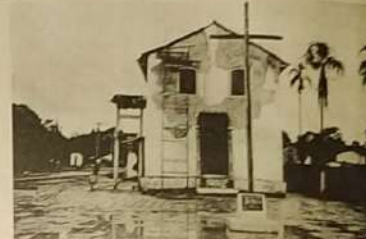
Situação atual das finalizações da obra, que deve terminar em fevereiro.

As obras de recuperação e restauração da igreja Nossa Senhora do Rosário, começaram no início de agosto do ano passado e estão um pouco atrasadas em função das chuvas, mas devera ser concluída no final de fevereiro, se as chuvas colaborarem, a igreja foi construída no século XVIII e estava em situação precária, ao ponto de quase desabar, após avaliação do IPHAN (Instituto do Patrimônio Histórico Nacional) providências foram tomadas e os recursos apareceram, vindo um patrocínio de 90 mil reais