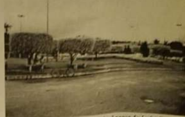
Jardinação embeleza principal praça de Jesópolis.

É impossível chegar a Jesópolis, sem antes passar pela praça da entrada da cidade que está toda jardina, embelezando ainda mais o município. A prefeitura municipal também vem priorizando a limpeza urbana e o dinamismo do prefeito Sebastião Santana de Oliveira. Está trazendo ainda mais benefícios a Jesópolis, está sendo entregue a população mais uma importante obra, a iluminação pública da rua 04 e da avenida Rio de Janeiro, a obra foi alçada em 26 mil reais, que está sendo bancado com recursos da prefeitura.