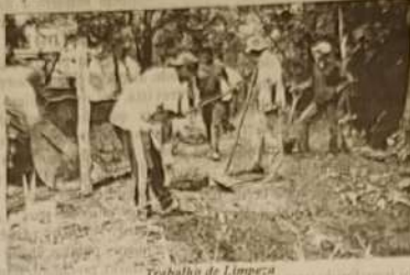
Trabalho de Limpeza

Uma empresa especializada em limpeza e recuperação do meio ambiente foi contratada e trabalhou com 60 (sessenta) homens dia e noite no recolhimento do produto atingido aproximadamente 6 (seis) km.