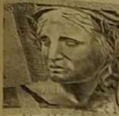
Lá se foi o meu real

Foi aprovada recentemente pelo congresso nacional, a nova taxa de contribuição da iluminação pública, mais para as prefeituras, cobrarem do consumidor a referida taxa a partir do mês de janeiro, é necessário que esta lei seja regulamentada pelas Câmaras Municipais, prevista no artigo 149-A da Constituição Federal, é sem sombra de dúvida mais um ônus para a população pagar.