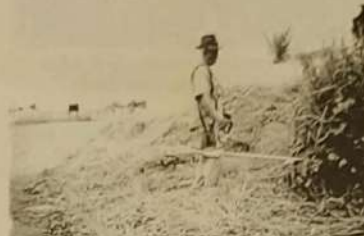
Funcionário da Prefeitura de Ouro Verde fazendo limpeza de lotes.

O prefeito municipal de Ouro Verde de Goiás Sebastião Bruno, está intensificando o trabalho de limpeza urbana, visando a segurança da população com limpeza dos lotes baldios com isso o cuidado tem sido redobrado na prevenção ao Dengue.