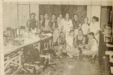
Formandos do curso de costura que teve especialização em jeans e malha.