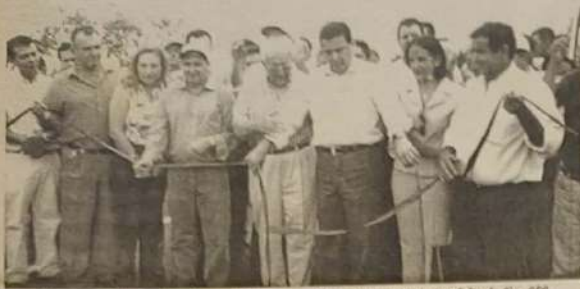
Marconi Perillo, juntamente com lideranças políticas, inaugurando o asfalto da Go-080

O governador Marconi Perillo juntamente com o presidente da AGETOP Dr. Carlos Rosemberg, inaugurou no último dia três, o trecho da rodovia da GO-080 que vai da BR-153 Jaraguá a Goianésia, reabilitado dentro do programa de melhoramento e gerenciamento da malha viária de Goiás (pró-melhor), financiado pelo Banco Mundial (Bird) e Tesouro Estadual. A AGETOP (Agência Goiana de Transportes e Obras) concluiu a obra de reabilitação dos 52,76 quilômetros da GO-080 num prazo recorde de 195 dias, o custo da obra ficou avaliado em R$ 7.684.875,79.