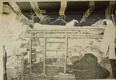
Cama onde os menores dormiam.