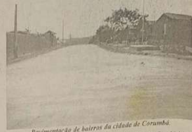
Pavimentação de bairros da cidade de Corumbá.