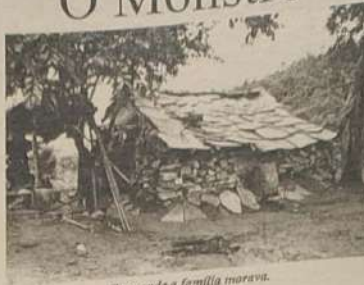
Casa onde a família morava.