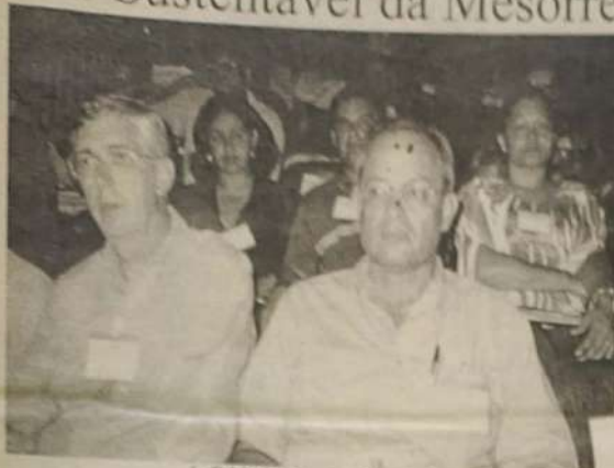
Análise do Fórum em Pirenópolis

Em agosto de 1999, foi criado o Ministério da Integração Nacional, como o próprio nome já diz, ele tem o objetivo de desenvolver projetos e de integração nacional, promovendo o desenvolvimento regional.