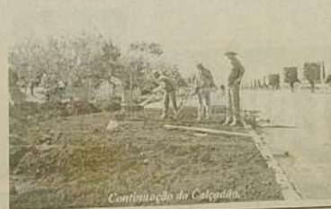
Continuação da Calçada

A arborização que já foi iniciada deixará assim a cidade de Itaguari ainda mais bonita.