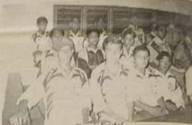
Time de Futebol

conscientização da população, melhorando assim cada dia mais a vida de todos nós.