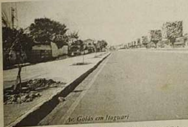
Av. Goiás em Itaguari