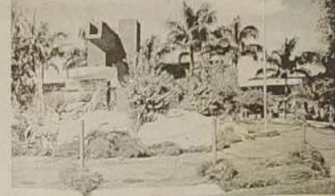
Praça Central de Itaguaru

A cidade de Itaguaru continua cada vez mais linda. A administração é atuante em todos os setores, mas tudo isso só é possível porque existe a participação direta do povo itaguaruense.