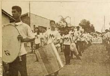
A fanfarra do Colégio Estadual Maria Assunção desfilou mostrando ritmo, harmonia e elegância.

O prefeito ressaltou a sua satisfação de estar fazendo parte de um momento tão especial e parabenizou toda comunidade por se comprometer com o crescente desenvolvimento do município.