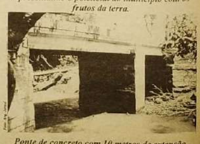
Ponte de concreto com 10 metros de extensão sobre o Córrego Ribeirão, entregue a comunidade do município nas comemorações dos 50 anos.