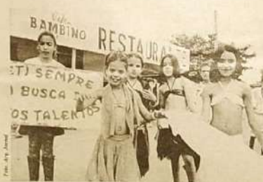
O PETI cuidando de seus talentos. Desfilou com vários blocos entre eles destacou-se a Dança do Ventre.