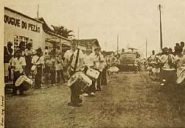
Fanfarra Mirim da creche Dona Zezé.