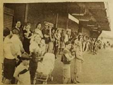
A comunidade de Carmo do Rio Verde prestigiou as apresentações dos desfiles por toda a avenida.