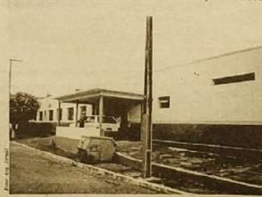
O Hospital Municipal César Caldas foi reativado e reinaugurado no aniversário da cidade.