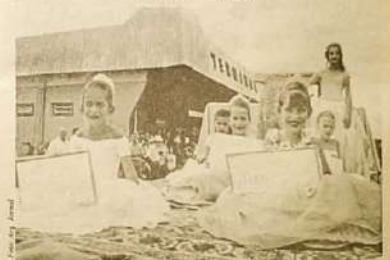
Carro alegórico com várias crianças representando o potencial do município com os frutos da terra.