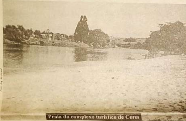
Praia do complexo turístico de Ceres

A administração da cidade de Ceres, convida a toda população goiana, em especial a do Vale do São Patrício, para conhecer o Complexo Turístico da