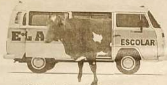
Vitória da Vaca, Vitória dos Policiais