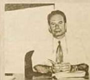
de delegado adjunto.