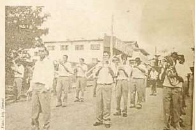
A Banda Municipal da cidade de Uruana desfilou tocando o tradicional "Parabéns pra você" entre outras melodias.