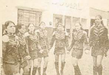
As estudantes desfilaram em um bloco homogêneo fazendo diversas apresentações ao longo do desfile.