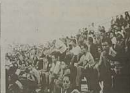
Espectadores assistem a bonita apresentação do peões no rodeio