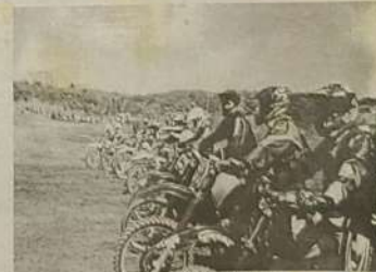
PONTO DE LARGADA