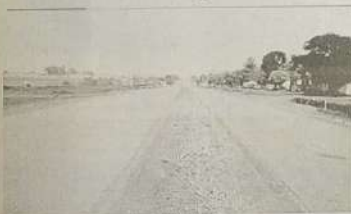
Br 070 Duplicada

Já é uma realidade a duplicação da BR 070, na zona urbana da cidade de Itaguari. A obra facilitará o acesso à cidade e conta também com um trevo.