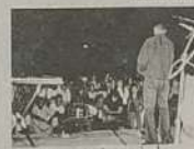
Apresentação musical durante o FESTCOM

Aconteceu no dia 30 de agosto a badaladíssima Festicom, no Colégio