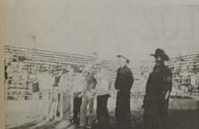
Locutor de rodeio e os peões que participaram da montaria amadora, em Itaguara.