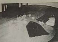
Material apreendido apreendido 02 armas de fogo, 02 cartuchos, latas com resíduos de merla, um cachimbo utilizado no consumo de "crak", além de 02 pés de maconha e capuzes

trabalha como pedreiro e mecânico de máquinas de costura, objetos que podem indicar seu envolvimento com o tráfico e até mesmo com assaltantes. Foram