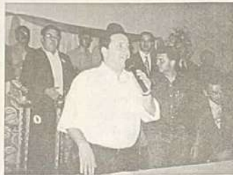
Garotinho fala aos evangélicos em Anápolis

converteu-se ao protestantismo após o acidente ocorrido em 1994. Ele tem dado o seu testemunho de fé nas várias cidades que visita em todo Brasil. O candidato está confiante em sua vitória e na resolução de todos os problemas que afligem o povo brasileiro.