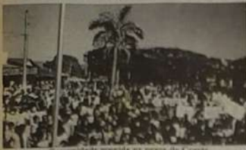
Comunidade reúne-se na praça do Ceres.

No dia 23 de agosto aconteceu um maravilhoso encontro na praça do coreto, na cidade de Jaraguá. Cerca de quatro mil pessoas, entre jovens, autoridades e educadores participaram de uma manifestação antidrogas. O evento marca o início do projeto "Segunda Milha" na cidade. Este projeto visa combater o vício, através da conscientização a partir do apoio de toda comunidade. O clima foi de total harmonia e nem uma das escolas municipais, estaduais ou particulares ficaram de fora. Muitas turmas levaram cartazes e faixas com dizeres que incentivam a vida. Alguns jovens também pintaram seus rostos em manifestação.