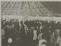
A população se divertiu dançando ao som automotivo