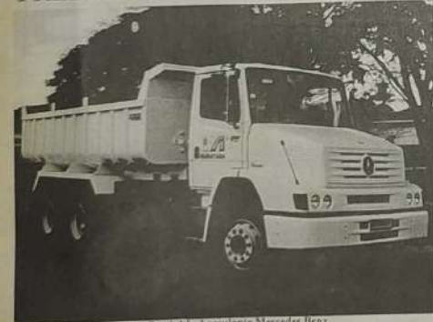
Caminhão basculante Mercedes Benz