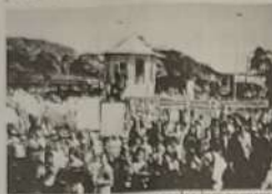
Participação de todas as escolas jaraguenses.

Após os breves discursos foi realizada uma caminhada que percorreu as principais avenidas da cidade. A participação efetiva da sociedade deixa claro que é preciso chamar a atenção das pessoas para o grande malefício causado pelas drogas aos viciados e suas respectivas famílias. Este projeto é uma alternativa para se prevenir e controlar o uso de drogas em todo país.