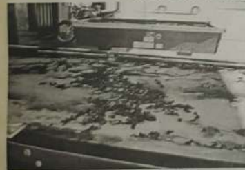
Mesas de sinuca danificadas pelo fogo