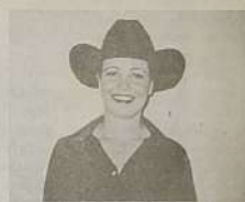
Princesa Danúzia Aurora