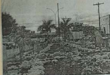
Um dos belos trabalhos de Jardinagem e paisagismo que a Secretaria de Agricultura e Meio ambiente vem desempenhando.

A Secretaria Municipal de Agricultura e Meio Ambiente, como todas as Secretarias da administração Municipal, enfrentam uma problemática seria de ordem financeira. Os recursos são poucos, dentro destes poucos recursos, as atividades que a Secretaria vem desempenhando são consideradas de forma positiva.