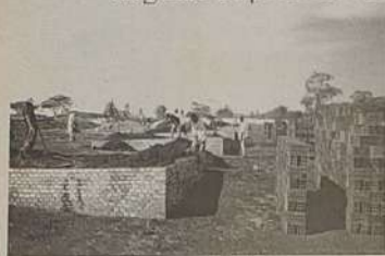
Início da construção das trinta casas.

Itaguari é mais uma cidade do Estado de Goiás, que ressenete-se do abandono a que foi relegada pelo Governo Estadual.