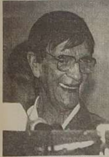
Medium Chico Xavier

Faleceu no último dia 30 de Junho (domingo), o médium mineiro Francisco Cândido Xavier, ou simplesmente Chico Xavier.