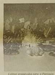
Lulhas granizadas para o Pároco

A Prefeitura também ajudou a paróquia, nesta grande festa que a cada ano deverá ser melhor.