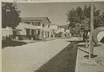
Início do reaparelamento asfáltico de Jaraguá.