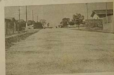
Ruas que estão sendo pavimentadas.

O prefeito tem contado com o apoio do ex-Secretário de Estado,