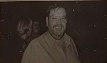
Deputado Federal Norberto Teixeira

avalia o Estado de Goiás e sua atual administração? Norberto Teixeira: Goiás está crescendo naturalmente. Não é o governo, mas o próprio povo que está no comando do desenvolvimento.