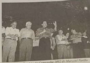
Primeiro Comício da Campanha 1992 de Marconi Perillo

O governador Marconi Perillo, candidato a reeleição iniciou sua campanha na cidade de Goianésia, no último dia 06 de julho, assim como aconteceu no pleito anterior.