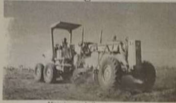
Máquinas trabalhando na obra