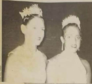
Princesa e Rainha da beterraba