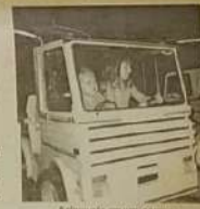
Barragem em um parque montado no Praça

dia 21 de Junho e terminou no dia 30, no referido mês. Ela homenageou o padroeiro da cidade São