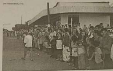
A juventude de Ipiranga marcando presença.

Manutenção do Centro Comunitário de Ipiranga de Goiás.