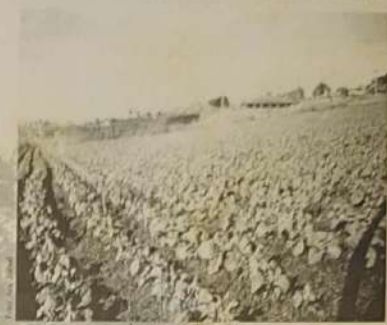
Lavoura de beterraba

Nos últimos oito anos tem acontecido na cidade de Ouro Verde de Goiás, a tradicional Festa da Beterraba.