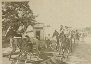
Saída da Cavalcada de Jaraguá.

"Ao chegarmos a Trindade éramos mais de cem cavaleiros". Os devotos plantaram nas cidades em que pararam para almoçar e jantar, várias mudas de árvores, dando um exemplo de preservação do meio ambiente.