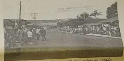
Participação da população no 2º aniversário da cidade.

Aquisição de três terrenos com quinze hectares para construção de Casas Populares, Obras Públicas, Praças, Avenidas, Ruas e Lixões. Estruturação Administrativa do Poder Executivo. Concessão de Serviços de Táxi. Criação de cargos efetivos através de concurso público. Convênios com Agência Rural: Ageneb, Correios, Saneng, Banco do Povo, Caixa Econômica Federal, Detran, Secretaria da Educação-Cooperação Estado/Município. Emissão Certidões Negativas de Quitação. Emissão de Alvarás de Licença para Localização.