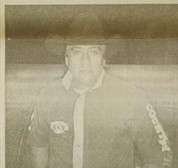
Reverendo o locutor de Rodeio mais querido de Goiás

"Para você que não me conhece, vou chegando e fazendo a minha apresentação