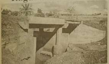
Ponte sobre o córrego Mota

As muitas obras que o prefeito de Itaguari vem desenvolvendo com recursos próprios do município fazem com que a comunidade daquela cidade seja mais participativa na vida pública do município.