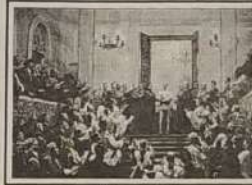
Obra consinta de três pintores: A Desforça dos Medicres

A Rússia possui um dos melhores acervos de arte do planeta. Muitas dessas obras estiveram ocultas aos olhos do público, devido ao policiamento ideológico exercido pelo regime comunista. Graças à Perestroika, no fim dos anos 80, seus tesouros puderam voltar à vista dos russos. Mais de 200 obras pertencentes ao museu poderão ser apreciadas na mostra 500 anos de Arte Russa , armada na Oca, no Parque Ibirapuera, em São Paulo.