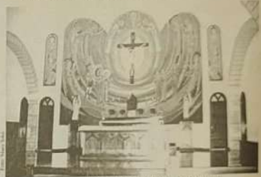
Abas da Igreja Matriz de Jaraguá.

Todos os cidadãos jaraguenses estão orgulhosos de possuírem uma das igrejas mais bonitas do Estado. A Igreja Matriz Nossa Senhora da Penha, apresenta uma arquitetura bonita e atraente aos olhos dos vários turistas que visitam nossa cidade.