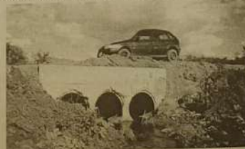
Buieiro, tripla na estrada que corta a Fazenda Sertãozinho

Além dessas obras muitas outras estão em andamento. Esta é uma administração de igualdade.