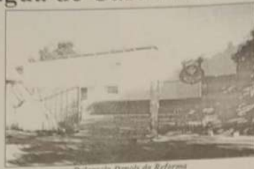
Delegacia Depois da Reforma

Esperamos que ele possa nos honrar com sua presença, em nossa cidade por muitos anos, tendo certeza de que o carinho recíproco entre ele e Jaraguá será perene.