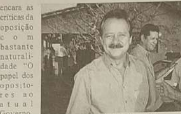
Deputado Federal Jovair Arantes

encara as críticas da oposição e o m bastante naturalidade "O papel dos opositores ao atual Governo, contribui para o nosso aprimoramento". O próprio Maguilo Vilela, em entrevista ao renomado jornalista Boris Casoi, reconhece o grande trabalho desenvolvido no Estado e teceu elogios aos projetos e programas sociais de Marconi Perillo.