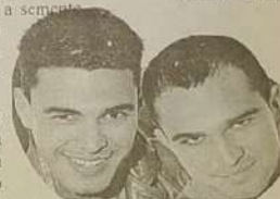
Os filhos famosos: Zezé de Camargo e Luciano