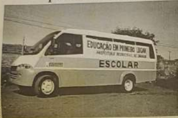
Microônibus adquirido pela prefeitura de Jaraguá.