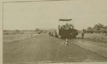
Go 080 - Jaraguá a Goianésia

A bem pouco tempo o Jornal O Regional relatou a precária situação que se encontrava a GO 080. O grande sonho da população em especial a de Goianésia era ver a rodovia restaurada, ela foi feita no Governo de Otávio Lage e so agora 32 anos depois ela esta sendo reconstruída.