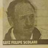
LUIZ FELIPE SCOLARI

Parabéns Goianésia, Pelos Seus 49 Anos de Progresso