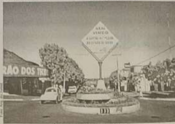
Área comercial de Rubiataba