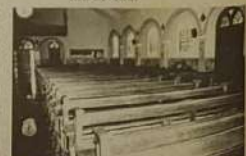
Bancos novos, ao fundo os Maravilhosos Vitrais

O Padre que veio de Anápolis há dois anos, fez questão de enfatizar que recebeu uma paróquia cheia de dívidas, mas que Graças a Deus e ao apoio da população, pôde concretizar esta obra de arte em forma de santuário, sem constituir nenhuma dívida.