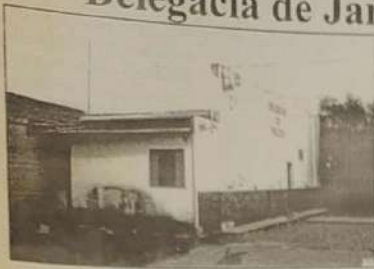
Delegacia antes da Reforma

A reforma da Delegacia de Jaraguá está praticamente concluída dando um exemplo de quem tem competência faz, que não tem espera.