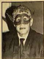
J. B. Braz Em Ritmo de Festa