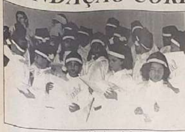
Coral de alunos da fundação.

A Fundação Córdoba de Freitas foi fundada em 1983. E desde então vem prestando um exemplar serviço a comunidade de Jaraguá. Inicialmente eram apenas quatro salas de aula. Hoje já conta com oito salas uma ampla cozinha com refeitório e um grande salão para reuniões, recepções e lazer para as crianças.