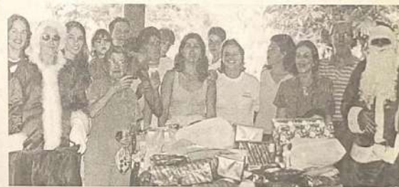
Presidente, Funcionários professores e colaboradores da fundação.

A Fundação Córdoba de Freitas foi fundada em 1983. E desde então vem prestando um exemplar serviço a comunidade. Inicialmente eram apenas quatro salas de aulas, hoje já conta com oito salas, uma ampla cozinha com refeitório e um grande salão para reuniões, recepções e lazer para as crianças.