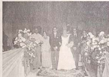
Os pais do noivo, os noivos e os pais da noiva