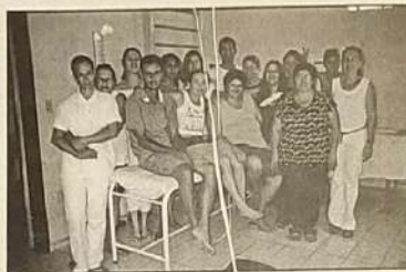
Alguns Alunos do curso.

Foi Realizado de 03 a 14 de dezembro na Clínica Físio-Center o curso de massagem. Esse curso faz parte do programa do governo, através do SENAI/FAT e prefeitura de Jaraguá.