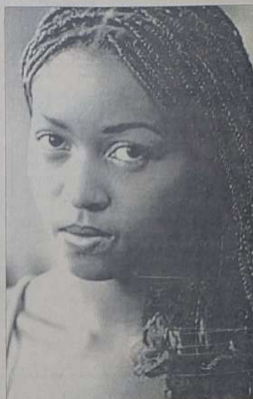
Vindos da África, os negros adquiriram características essencialmente brasileiras

Nesse contexto, é impossível negar que quase a totalidade dos aspectos da cultura brasileira traz a marca da cultura africana, sua língua, sua religião, sua música, sua dança, mesmo com a repressão que tais manifestações chegaram a sofrer. Um exemplo situa-se no Brasil-República, quando a idealização do modelo de cultura europeia adotado fez com que a