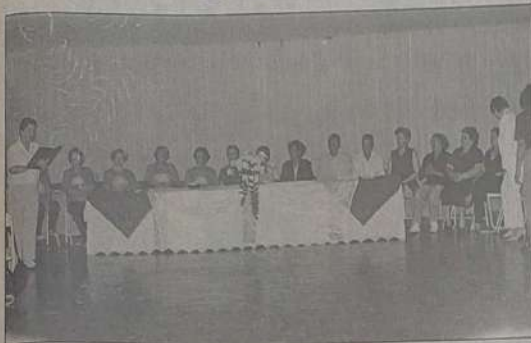
Mesa de Honra com Diretoria Empossada

Em 14 de Fevereiro de 2001, numa alegria e descontração, no salão social do Clube Rio da Prata, foi empossada a 1ª diretoria do clube Primavera, ou seja Clube da Melhor Idade de Jaraguá.