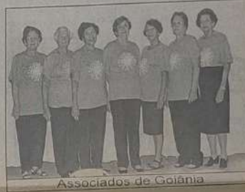
Associados de Goiânia