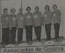
Associadas de Goiânia