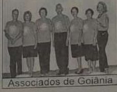
Associados de Goiânia