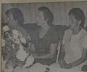
Presidente Dete Ladeada por 2 integrantes do Clube