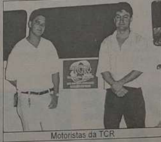
Motoristas da TCR