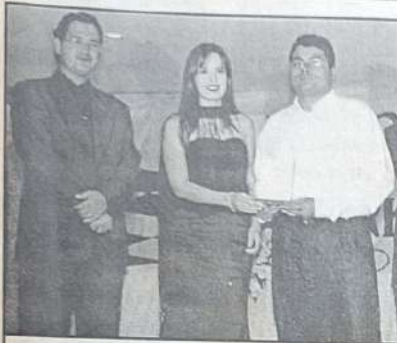
ODONTO CENTER - CLÍNICA ODONTOLÓGICA