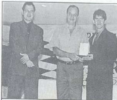
MOTEL MON CHERRY