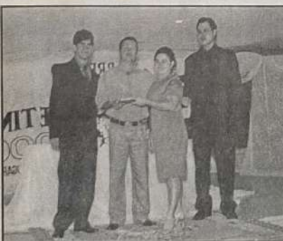
IMOBILIÁRIA - MORIÁ IMÓVEIS