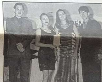
DROGARIA E FARMÁCIA