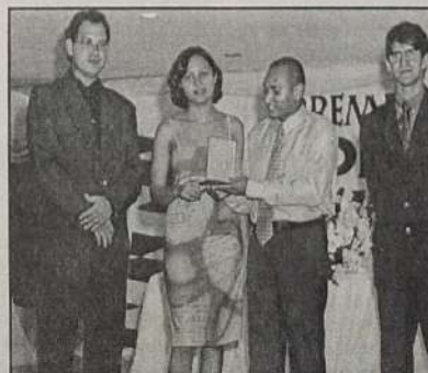
JORNAL - O REGINAL