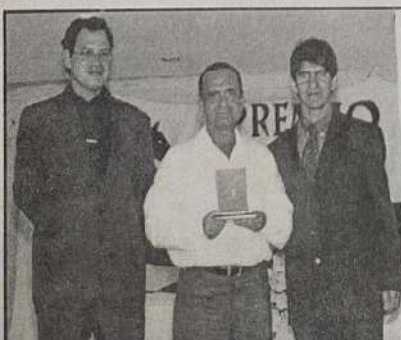
RELOJOARIA - LISTA TELEFÔNICA E PUBLICIDADE