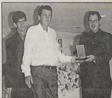
AGRO VETERINÁRIA - CLÍNICA