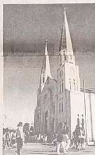
Igreja Matriz Nossa Senhora Da Penha

O povo jaraguense é povo hospitaleiro e religioso com uma população predominantemente católica com suas várias Igrejas algumas delas verdadeiros patrimônios históricos datadas do século XVIII. Os Evangélicos também estão presentes na cidade desde a década de 1940 com suas 23 denominações e um número estimado em 8 mil membros. Apesar de toda essa religiosidade o povo jaraguense é povo tolerante fazendo do carnaval de rua de Jaraguá um dos mais animados de Goiás.