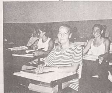
Alunos(a) do curso de enfermagem

Os funcionários práticos de enfermagem estão com os dias contados. O Governo Federal determinou que a partir de 2006, somente "Técnicos em enfermagem" fará parte do quadro de funcionários do ministério da saúde.