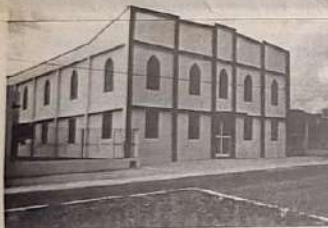
Igreja Assembleia de Deus de Madureira

Jaraguá possui uma área de 1.895,6 km² e uma população estimada em 33 mil habitantes. O município apresenta com orgulho ao país suas tradições e seu folclore.