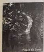
Praça da Serra

Serra de Jaraguá Uma bela opção para quem curte a natureza nas alturas e para prática de esportes radicais, como asa delta e parapente. No local são encontradas trilhas que levam a cavernas e nascentes. O destaque é o Poço da Serra.