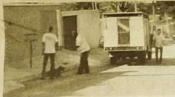
Dos 97 cães recolhidos das ruas pelo serviço do Centro de Zoonoses de Jaraguá, nenhum deles foi sacrificado conforme estava previsto para

acontecer no último sábado 23. O motivo do não sacrifício dos cães foi a intervenção de uma ONG de proteção aos animais, com sede em Anápolis.