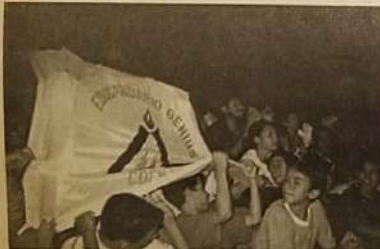
Jogos intercooperativos do centro-oeste

A equipe Gênus (Cooperativa de Ensino de Jaraguá) que representou Goiás nos jogos realizado em Campo Grande MS. Os jogos foram realizados com participação das seguintes equipes sendo todas cooperativas: Coenja (Jaraguá), Comigo (Rio Verde), Cooprec (Goiânia), Coopro (Goiânia), Comiva