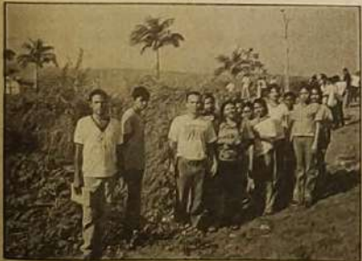
Alunos do Colégio Estadual Diógenes de Castro Ribeiro, visitam o Rio Vermelho

Alunos do Colégio Estadual Diógenes de Castro Ribeiro, abraça o projeto de recuperação do Rio Vermelho e faz visita em toda extensão do seu leito, fazendo assim a primeira avaliação da real situação que encontra nosso rio.