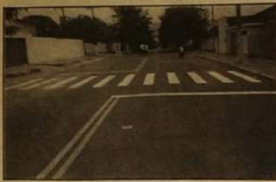
Faixa de pedestres da Av. Paulo Alves