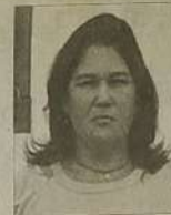
Por: Enfermeira Ana Cristina Sussekind Freitas

Em Goiás, as estimativas para o ano de 2008 e 2009, apontam que ocorrerão 4100 novos casos de câncer