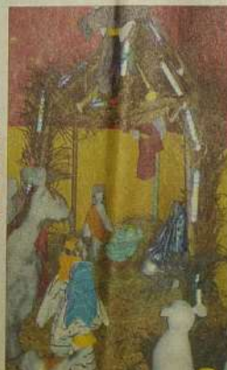
Trabalhos dos alunos da rede municipal com material reciclado

Feliz Natal a todos que participaram e construíram a felicidade deste Natal Jaraguense.