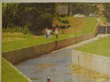
Canalização do Rio Vermelho

Com participação voluntária de jaraguenses especiais que não se cansam de doar em se a nossa cidade,