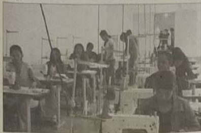
Confecção; principal atividade econômica de Jaraguá

Sabidamente os empresários de Jaraguá escolheram para base de suas atividades econômicas a indústria do vestuário elemento fundamental e de primaríssima necessidade e isto pode nos colocar em situação privilegiadíssima neste momento econômico mundial.