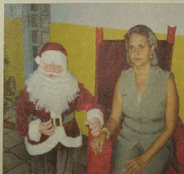
Secretária da educação e a exposição de trabalhos dos alunos com material reciclado