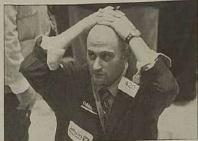
Crise: não basta levar as mãos à cabeça, é preciso dirigir ações rumo a produção

investimentos, menor oferta de trabalho, restrição da produção industrial, menor nível de emprego, menor disponibilidade de recursos no mercado e finalmente maior tensão nas relações de produção e consumo, crise econômica.