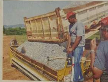
Pavimentação nas comunidades da zona rural

Com a participação do universo escolar, por intermédio da Secretaria da Educação, há no início do mês de dezembro, no Palácio da Educação, uma exposição de trabalhos das escolas da rede municipal, usando basicamente materiais reciclados deu o tom inicial deste Natal especial,