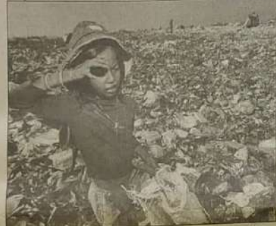
Não podemos permitir que a crise justifique a miséria que se espalha pelo mundo