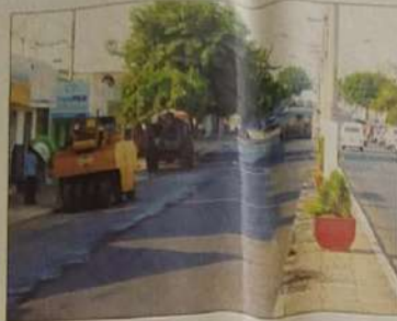
Revitalização do asfalto do centro

Ante a realidade de poucos recursos, ante a realidade do compromisso dos recursos disponíveis com realizações como asfalto, iluminação pública, saúde, educação, realizações