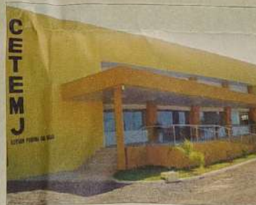
Construção do Centro Tecnológico da Moda