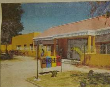
Reforma e ampliação do Hospital Regional