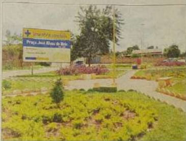
Urbanização e construção de praças para o lazer público

Novamente pelas mãos da parceria, novamente em conjunto orquestrado e regido por uma liderança que se aperfeiçoa e amplia a cada dia, especialmente pela humildade e pelo respeito a cada servidor, a cada companheiro, a cada adversário, a cada cidadão, a prefeitura de Jaraguá está oferecendo aos jaraguenses