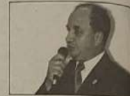
Macaíba fez o grande elo legislativo e executivo e na condição de presidente da Câmara foi o braço seguro do executivo na Câmara, outro resultado positivo nas urnas.