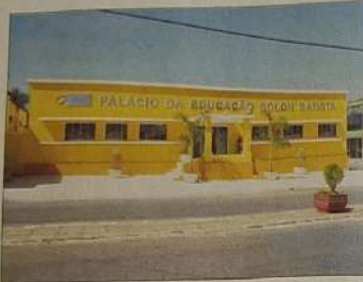
Investimentos estruturais e técnicos na educação municipal

como o Centro Tecnológico da Moda, Palácio da Educação, urbanização digna de praças e logradouros, consolidação de praças de esportes que fazem tanta importância para toda a sociedade, sem jamais poder deixar de lado uma data como o Natal, a administração municipal, mais uma vez, recorreu ao conceito parcerias, mais uma vez recorreu ao princípio democrático de fazer junto, realizar pela participação de todos no objetivo comum.