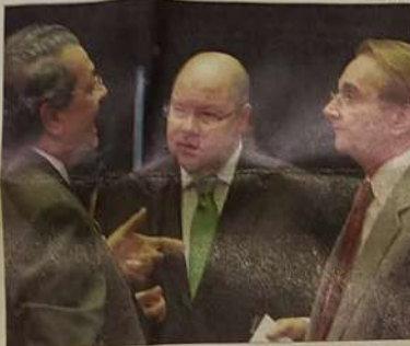
Senadores Jaime Campos, DEM MT, Demostenes Torres, DEM A-GO e Agripino Maia, DEM RN

Nos próximos dias haverá de ser concluído o tramite da PEC e consolidada esta nova ordem de eleitos em Jaraguá e também em todo o Brasil, dando maior representatividade ao cidadão no universo legislativo municipal e colocando a realidade, especialmente nos municípios de menor e pequeno porte, mais próxima das necessidades destes.