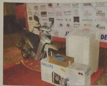
Com a participação da ACLJ, CDL e dos empresários jaraguenses, a secretaria de Indústria e Comércio souou esforços e realizou a promoção Show de Prêmios