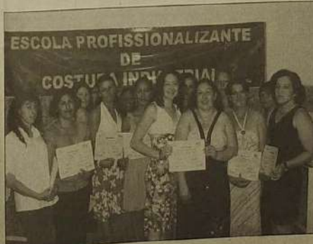
Em sindicatos sérios o aperfeiçoamento profissional é uma constante

Até quando, numa cidade em que a economia é basicamente construída pela categoria dos trabalhadores na indústria de confecção, o instituto maior de defesa destes trabalhadores estará sujeito a ações tão inconsistentes e tão desrespeitosas aos interesses destes trabalhadores?