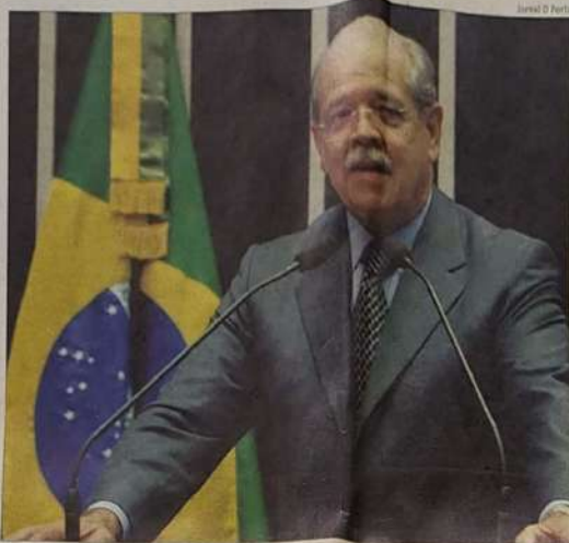
Jaraguá O Portal

A proposta do deputado Pompeo de Mattos (PDT-RS), conhecida como "PEC dos Vereadores", já aprovada pela Câmara dos Deputados, altera dispositivos constitucionais relativos ao quantitativo de vereadores, limitando as despesas das câmaras municipais a percentuais sobre a receita anual do município... página 03