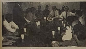
Assim pensando e partindo do princípio, tanto por parte dos vereadores presentes que hipotetizam

abrangência e identidade com um dos mais significativos universos da vida social de Jaraguá e por certo, realizado com seriedade e competência haverá de lograr o êxito esperado.