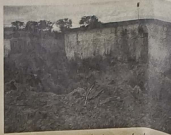
Uma publicadas das fotos do descaso e do abandono na gestão do patrimônio da Saneago em Jaraguá

Sonhamos em publicar a elegância dos mansos, a beleza dos dignos, a polidez dos justos, a eficiência dos sábios e principalmente a dignidade dos humildes, entretanto não nos furtamos e jamais nos furtaremos se tivermos que expor toda a animalidade de alguns que, imaginando que o mundo ainda perpetua nas escuras eras pré-glaciais agridão ou vilipêndem ao