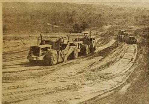
O Consórcio Intermunicipal Rodoviário vem desenvolvendo um extenso trabalho na restauração da pista que liga Jaraguá com Itaguara, no momento que também atende uma reivindicação do Senhor Prefeito, ou seja a construção da nova ponte sobre o rio.