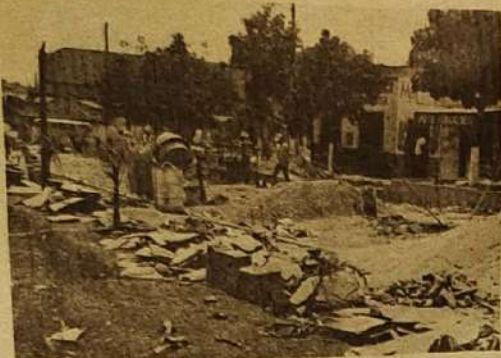
A juventude e também toda comunidade conta brevemente com mais uma opção de lazer, ou seja, a Secretaria do Desenvolvimento Urbano está ampliando a Praça do Coreto com a implantação do calçamento, que permitirá maior conforto aos frequentadores. (foto)