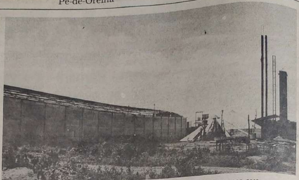
GRANELEIRO - As obras de construção do Novo Graneleiro, já estão com grande parte de suas edificações estruturadas, resolve-se com isso um antigo problema.

Que 1986, se converta no crescimento espiritual e material da nossa comunidade, reestabelecendo-se as mais belas tradições dentro de um mar de inovações e progresso.