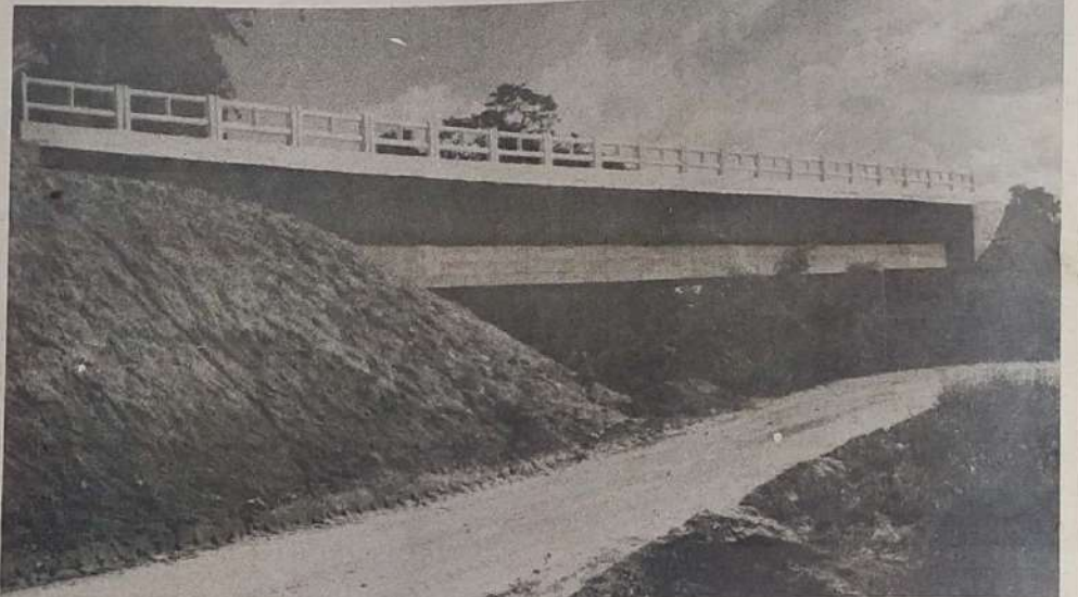
PONTÉ SOBRE O RIO PARI - Concluiu-se recentemente a construção da nova ponte sobre o Rio Pari, atendendo-se com isso a

a questão da falta de espaço para armazenamento de safra, pois com próprias declarações da CASEGO, de há muito o seu espaço tem sido insuficiente.