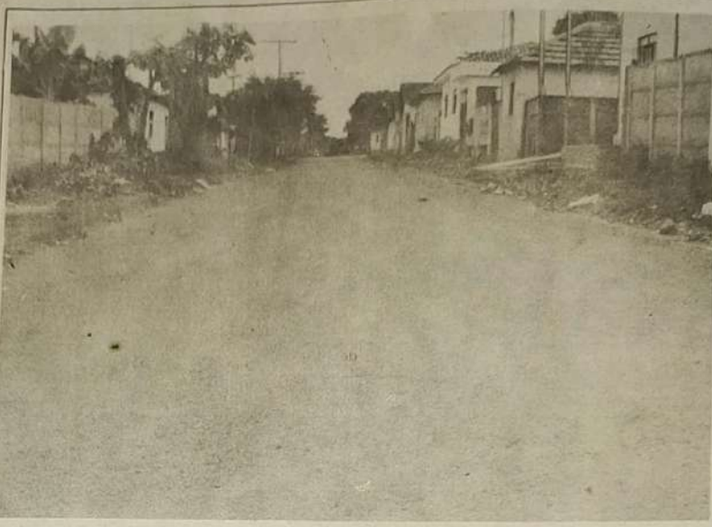
Estão sendo feitos os trabalhos de asfaltamento da parte central da cidade, onde era a antiga vila Brasilinha.

Hoje não são possíveis assumir posições de fechar olhos diante da situação, deve-se restabelecer condição de autocrítica, pois ao valorizar a mulher estar-se-á valorizando a si próprio e cometendo um ato de empobrecimento humano.