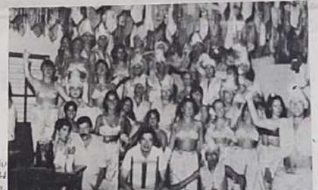
3º Dia No salão 34 componentes.