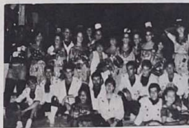
4º Dia. Após o grandioso concurso com apenas 24 componentes, pois o restante agradecidos foram embora.

Este foi o último Carnaval Bloco Incentivado pelos jurados que o Bloco Carnavalesco tentou ajudar a levantar o ânimo dos foliões e esperamos que o Bloco Incentivado pelos jurados algum dia não venham a ter a decepção da injustiça.