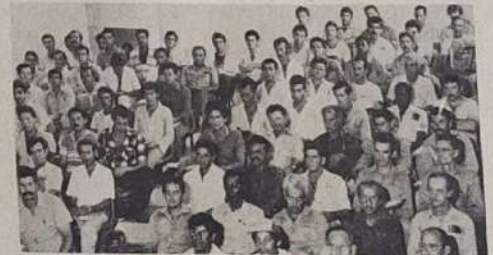
Os alunos reunidos no curso de treinamento da SUCAM

Com este trabalho a SUCAM vem buscando divulgar técnicas, métodos de prevenção contra a terrível doença, sendo que cada participante do curso torna-se automaticamente a ser um agente de saúde que irá transmitir em sua região uma nova visão de trabalho preventivo. Jaraguá marcou com isso mais um tento dentro do desenvolvimento social de sua comunidade com a realização brilhante da SUCAM deste curso de treinamento.