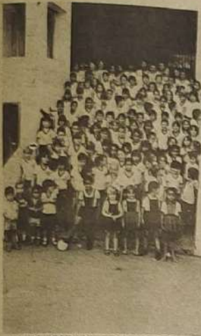
PARTICIPANTES DOS JOGOS

O Colégio N. Sra. de Monte Claro, está em fase de intensos treinos com os seus atletas de jardim de infância até 2º grau, nas modalidades de futebol de salão, vôleibol, queimada, natação, salto à altura, salto à distância, arremesso de peso, ping-pong, corrida de revezamento, 100m, 200m e resistência para a realização de seu quinto Jogos Olímpicos.