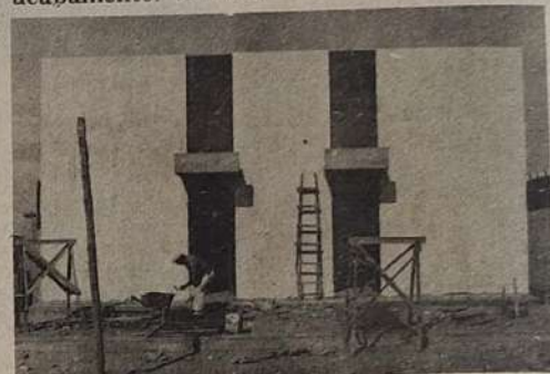
O NOVO PRÉDIO DA TELEGOIÁS

sua inauguração prevista para breve, quando entrará em vigor o novo sistema de telefonia.