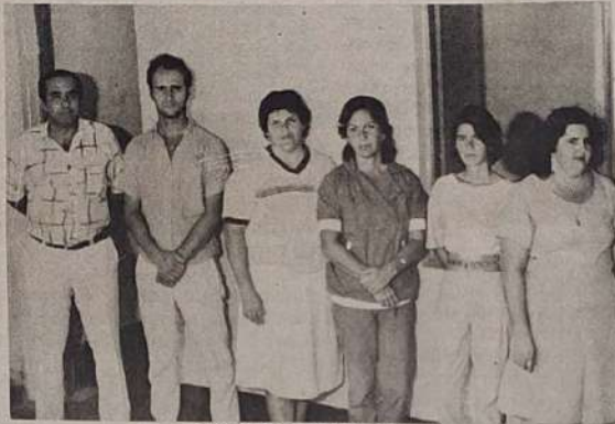
Diretoria da APAE Jaraguense

"Se você tem vontade de nos ajudar não espere que vamos até você, venha você até nós".