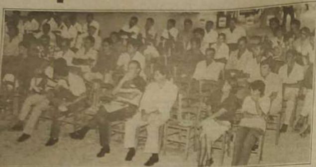
Representantes participantes do simpósio e expositores visitantes