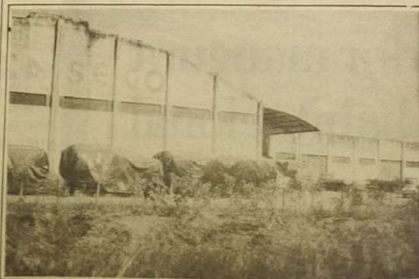
Os armazéns da CASEGO estão abarrotados

O governador Iris Resende Machado será homenageado, em Jaraguá no dia 29 de julho de 1985, com a entrega de título de cidadão jaraguense a ser entregue pelo Presidente da Câmara Municipal de Jaraguá.