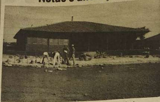
Este prédio sediará o artesanato da região do Vale do São Patrício

O Centro de Comercialização de Produtos Artesanais, na BR-153, poderá sediar uma exposição permanente dos produtos regionais, ou seja artesanatos das diversas cidades do Vale do São Patrício. (foto nº 6)