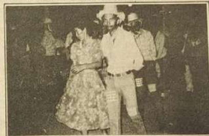
Quadrilha no Arraiá da Praça do Coreto