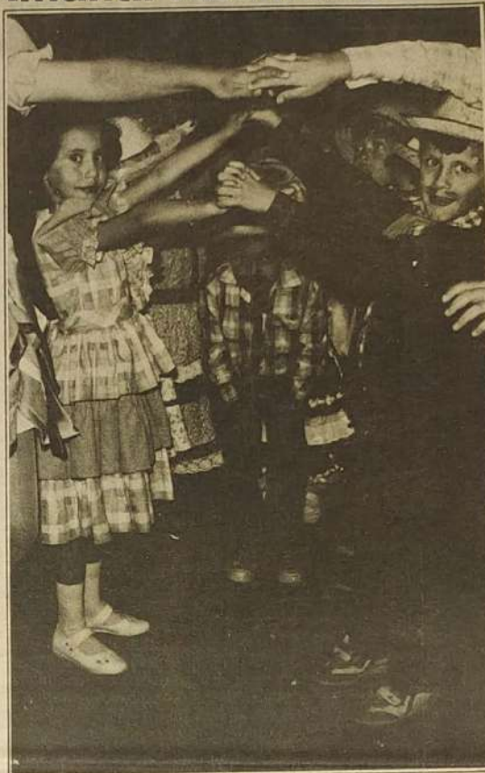
As crianças e as festas juninas