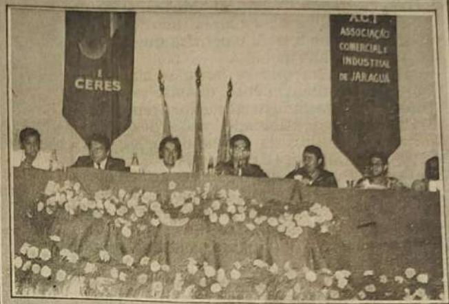
Empresários e homens públicos em busca da industrialização