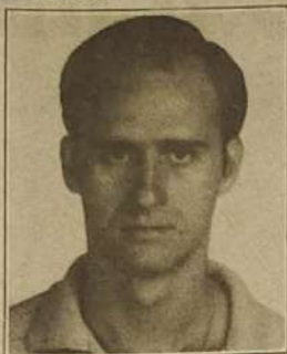
Psicólogo volta a Jaraguá

Como Psicólogo Educacional estou procurando junto ao Colégio Diógenes, desenvolver um trabalho de orientação e conscientização de nossos jovens para o objetivo de procurarem encontrar o seu eu.