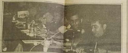
Secretário de Indústria e Comércio - deputado Walter José, do Governo Estadual apoiará as empresas através do FOMENTAR

Deputado Walter José, Secretário da Indústria e Comércio disse em Jaraguá "A preocupação maior da Secretaria de Indústria e Comércio do Estado de Goiás é adequar novos mecanismos de apoio a microempresa e as empresas em geral. Desta forma foi criado o FOMENTAR-Fundo de Fomentação de Atividades Econômicas, que visa financiar até 70% do ICM a ser recolhido pela empresa por um período de 02 (dois) anos com juros de 3% a.a. e mais 30% da variação da Correção Monetária. Acreditamos que esta fórmula constituirá em importante apoio para industrialização no Estado de Goiás. Novas empresas serão criadas e novos empregos gerados em um prazo relativamente curto."