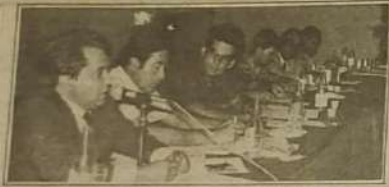
O Secretário do Planejamento de Goiás defende a geração de empregos