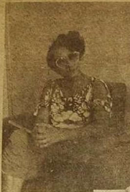
Orlandira: "a experiência está avançando em Jaraguá"