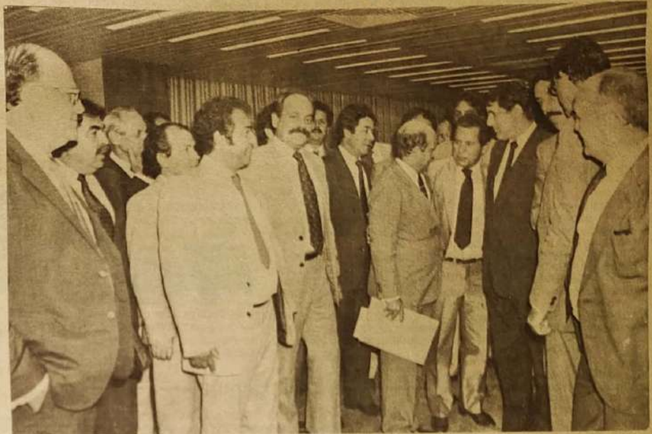
Em visita aos ministros, os municipalistas pedem alteração na política financeira

O ministro João Sayad informou aos 30 integrantes da delegação municipalista que a Comissão da Reforma Tributária está acelerando seus trabalhos e disse que há possibilidades de mudanças, ainda este ano, na área tributária. Os municipalistas solicitaram que um representante municipalista fizesse parte dessa comissão e o