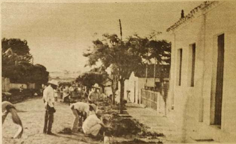
Comunidade participa do mutirão, embelezando a Rua das Flores

A população de Jaraguá vem tendo uma participação intensa nos mutirões de Limpeza promovidos pela Prefeitura. Esses mutirões são realizados aos fins de semana nos bairros e povoados do município. Começando às 5 horas da manhã de sábado, os moradores do bairro, utilizando as máquinas da Prefeitura, capinam, encascalham ruas, trocam lâmpadas, plantam flores, etc. Participam também fazendo o café da manhã para os que trabalham. Os mutirões representam uma forma de envolver a população na realização das obras que lhe interessam e também de aproximar a Prefeitura da comunidade, pois o prefeito Alano de Freitas e os secretários "mudam" para os bairros e povoados nessas ocasiões. Os primeiros locais beneficiados foram a Rua das Flores, Vila Colombo e Vila Isaura. Os próximos fins de semana estão reservados a Vila São José, Brasilinha, Vila Rio Vermelho, Artulândia, Mirilândia, Vila Palestina, Alvelândia, São Geraldo, Santa Bárbara e Monte Castelo. Página 11.