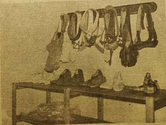
Os sapatos e cintos da Farrapos demonstram seu bom gosto

Atualmente, a Farrapos conta com oito funcionários em Jaraguá e mais dois na pronta entrega, instalada em Brasília. As roupas da confecção, assim como os calçados cintos e bolsas, são vendidos em Jaraguá e também em Brasília, onde a Farrapos tem seu maior mercado consumidor, mas, futuramente, pretendem abrir uma pronta entrega também em Goiânia. Mas, isso, quando sua produção atender à procura que uma nova filial pode criar.