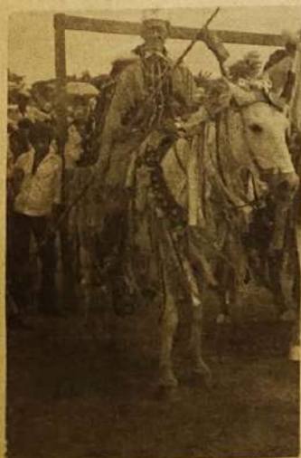
Cavalhada, a história é recriada pelo povo

O mês de maio é vivido intensamente pelo jaraguense. As festas tradicionais do Divino Espírito Santo, do Rosário e São Benedito se encarregam de reunir na cidade moradores antigos, jovens que foram estudar fora e vizinhos vindos de municípios da região. São momentos de muita beleza em que a tradição se faz viva através da Cavalhada, Reinados, novenas e folias, que contam a história de Jaraguá. Página 12.