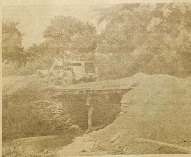
As pontes facilitam o acesso a todo o município