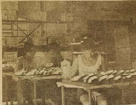
A linha de produção da Chulezinho