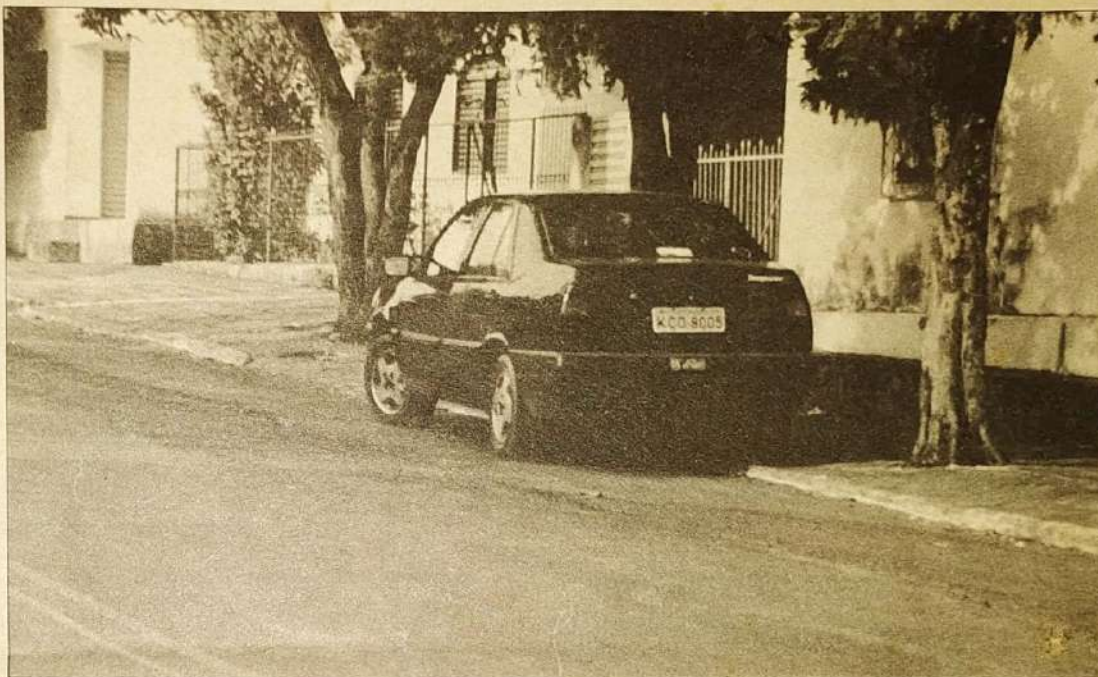
O Tempra 16 válvulas, ano 96, é apenas um dos veículos da frota do prefeito Nédio Leite. Antes ele só tinha uma D-20 89

Só em equipamentos importados da Argentina ele gastou 120 mil dólares (isto mesmo, 120 mil dólares!). O prédio, cuja construção já está em andamento, não sairá por menos de 40 mil dólares, segundo projeções modestas de quem entende do assunto. Tudo isso, sem qualquer tipo de financiamento. Para completar, o prefeito vai gastar mais pelo menos 40 mil em equipamentos nacionais. Total dos gastos: 200 mil dólares. Nédio Leite, se investisse todo o seu salário bruto na implantação da lavanderia, sem tirar um centavo para despesas pessoais, teria de ficar mais de dez anos na Prefeitura para pagar os custos com essa lavanderia. Vai ser preciso muito sabão em pó e quibôa para limpar tanta sujeira. Nédio vai deixar o poder muito mais rico do que entrou. Ao contrário do Doutor Inhô, que quando saiu da Prefeitura exibiu uma declaração de renda do mesmo tamanho da que apresentara seis anos antes.