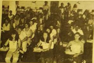
Treinamento de Professores: aperfeiçoando a mão-de-obra