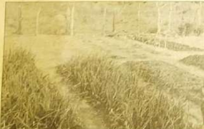
Horta Comunitária: mais comida na mesa do pobre