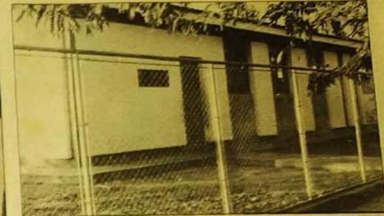
Centro de Saúde de Jaraguá: apoio de Inhô no setor de saúde pública