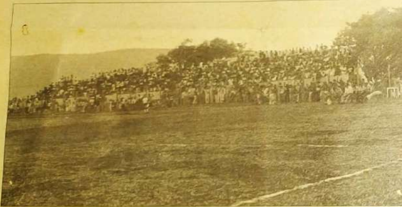
O Estádio Municipal deu novo impulso ao esporte na cidade e agora será iluminado pelo Governo do Estado