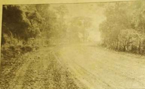
Estrada para Mirilândia: ação da Prefeitura aos distritos e povoados