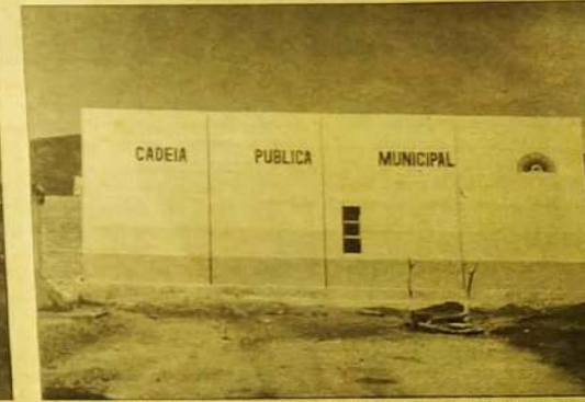
Cadeia Pública Municipal: mais segurança e tranquilidade para a população